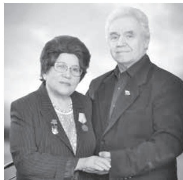
■ Фото из семейного архива.