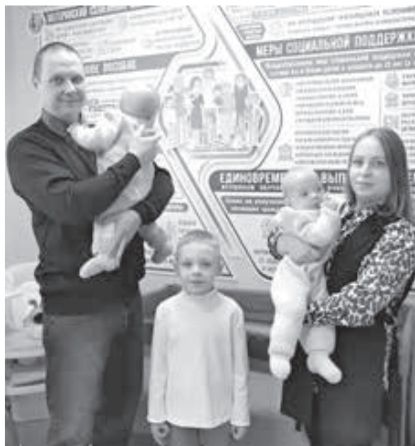
■ Фото с сайта администрации правительства Кузбасса.

Право на новую региональную выплату имеют семьи, в которых в этом или следующем году родился (родится) третий или последующий ребёнок. Обязательные условия: ребёнок должен быть рождён в Кузбассе, а его рождение – зарегистрировано в органах ЗАГС региона; родители должны иметь российское