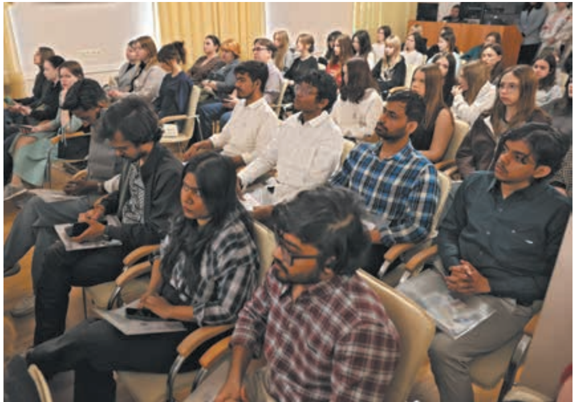
■ Момент встречи.