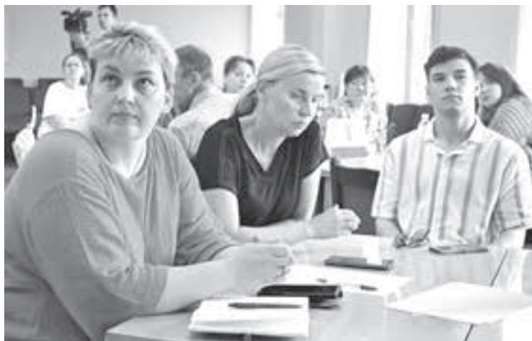
■ К выборам в Кузбассе обучат более четырёх тысяч наблюдателей.