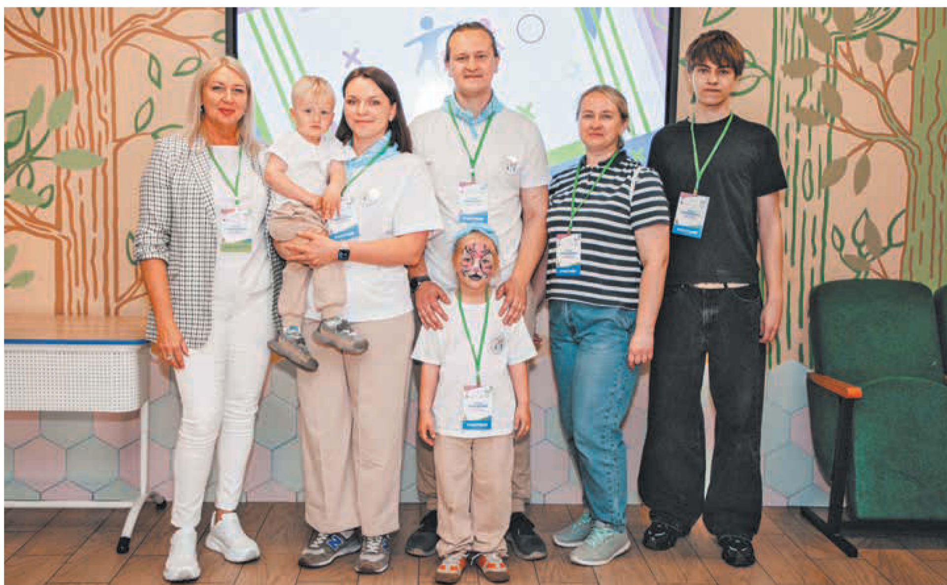
■ Семья Лебеденко из Киселёвска – победители конкурса «Молодая семья Кузбасса – 2026».