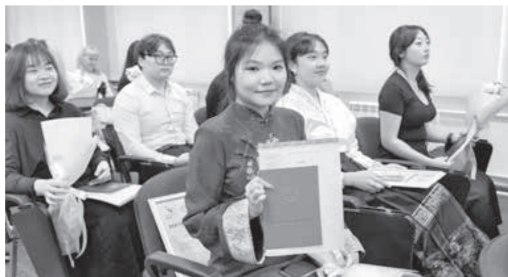
В нынешнем году это десятый выпуск представителей КНР.