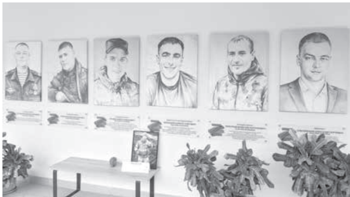
■ Экспозиция «Герои нашего времени».

НА СЕГОДНЯШНИЙ ДЕНЬ БОЛЕЕ 60 СТУДЕНТОВ ИНЖЕНЕРНОГО ФАКУЛЬТЕТА (ЗАОЧНОЙ ФОРМЫ ОБУЧЕНИЯ) АГРАРНОГО ВУЗА КУЗБАССА НАХОДЯТСЯ НА ЛИНИИ БОЕВОГО СОПРИКОСНОВЕНИЯ.