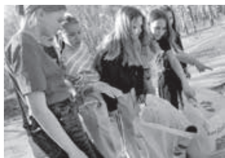
■ Фото из архива кемеровской школы № 74.

Более полугодя команды из 88 регионов России выполняли задания, организовывали мероприятия и воплощали в жизнь социально значимые проекты в рамках конкурса первичных отделений