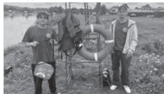
■ Фото Управления по делам ГО и ЧС города Кемерово.