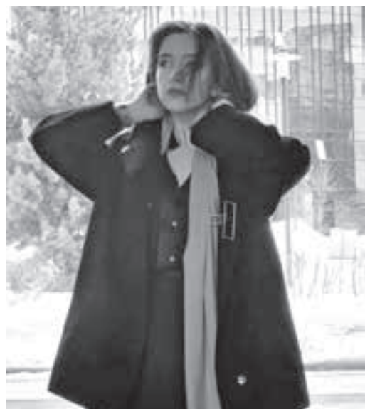
■ Фото из личного архива студентки.