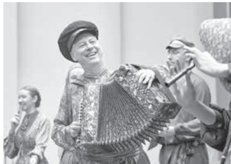
■ Фото Максима Федичкина.

Особенному инструменту и программа полагается особенная. В ней – истинно народные произведения: частушки-страдания, подлинные образцы сибирского фольклора сочетаются с лирическими «Подмосковными вечерами» и знаменитыми военными песнями «Казачки в Берлине», «Смуглянка». Прозвучит и «Прощание славянки».