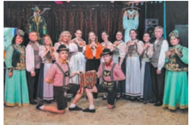
■ Совместная встреча кемеровских татар и немцев.

центром немецкой культуры города. Работая за стенкой друг у друга, коллективы часто объединяются для совместных встреч и мероприятий. А в рамках этнокультурного проекта «Ассамблея народов Кузбасса» татары взаимодействуют и с армянами, и с таджиками, и с узбеками.