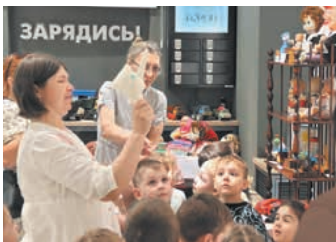
■ Фото Беловского музейно-выставочного центра.