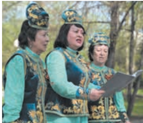
■ Песни Победы на русском и татарском.

Надо сказать, что активисты «Дуслык» дружат и с другими национальными объединениями. Так, уже больше 20 лет они соседствуют во Дворце молодёжи с