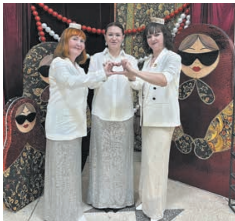
■ «Алга» на конкурсе «Поёт Кузбасс. Единство голосов».