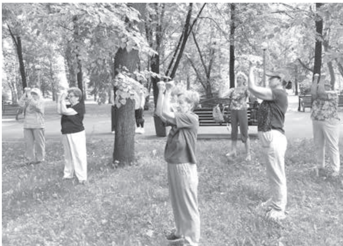
■ Фото Кузбасского центра общественного здоровья и медицинской профилактики.