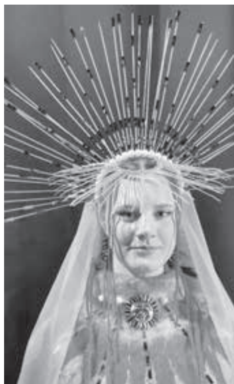
■ Фото из архива Кузнецкого техникума сервиса и дизайна.

«Легенды Тунгура» – это костюмированная вселенная, где фольклор становится футуристичным, где стирается