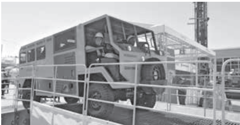
■ Фото Сергея Шпица.

тель представил на выставке первый 220-тонный газомоторный самосвал «БелАЗ-7530Р», у которого лучше характеристики по экономичности и экологичности по сравнению с аналогами, работающими на дизельном топливе, сообщила пресс-служба администрации правительства Кузбасса.