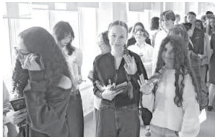
■ 1 июня одиннадцатиклассники сдали ЕГЭ по истории, химии и литературе.

Ну и, конечно, всегда важно соблюдать режим дня, вовремя ложиться спать, высыпаться, не забывать про физическую активность. Как показывает практика, если держать тело в порядке, то и голова будет работать хорошо, с волнением справиться проще.