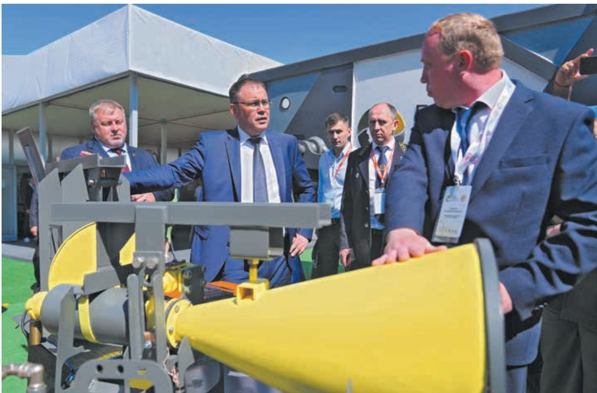
■ Фото Сергея Шпица.