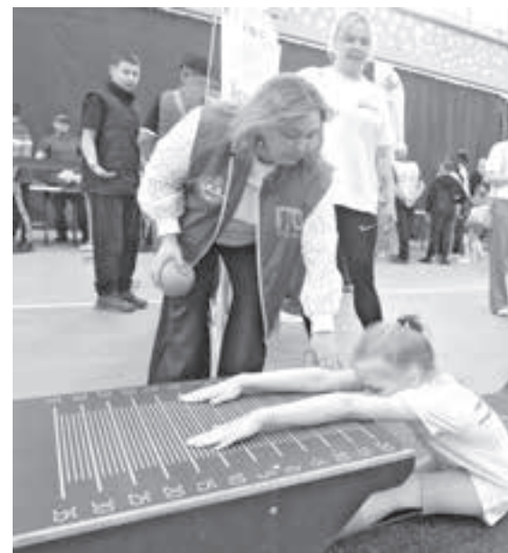
■ Фото Дмитрия Ярошука.