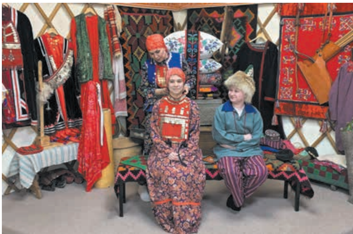
■ Яркий момент путешествия.