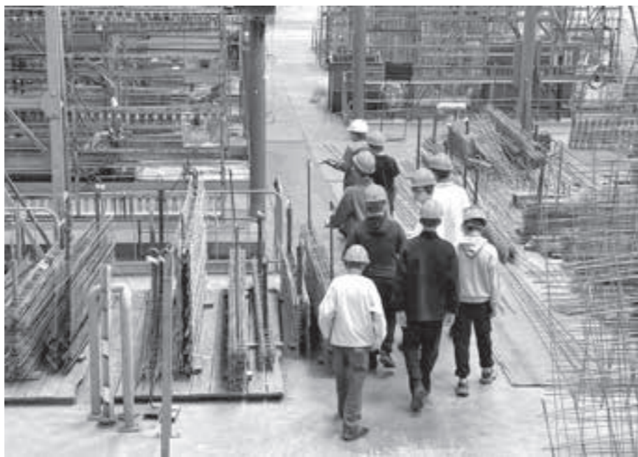
■ Фото из архива ЦОПП Кузбасса.