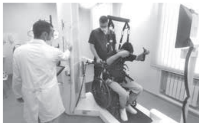
■ Фото Кузбасского клинического госпиталя для ветеранов войн.

На базе госпиталя работает отделение медицинской реабилитации, оснащённое современным оборудованием: тренажёрами для конечностей, вертикализатором, экзоскелетом, кистевым тренажёром, углекислотной ванной, инструментами для ЛФК, а также компьютерными программами для психологической реабилитации, лечебным комплексом для гидромассажа с подводным вытяжением позвоночника. Особое внимание заслуживает роботизированная система ходьбы, помогающая восстановить способность передвигаться у пациентов, полностью или частично утративших эту функцию.