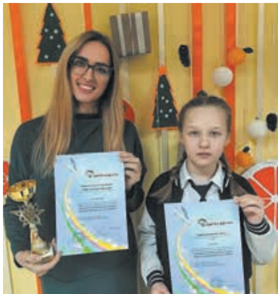
■ Фото из личного архива Татьяны Маслобоевой.

По традиции спектакли проходят в конце мая. На время класс превращается в зрительный зал, а место у доски – в импровизированную сцену. «Наш занавес претерпевал множество