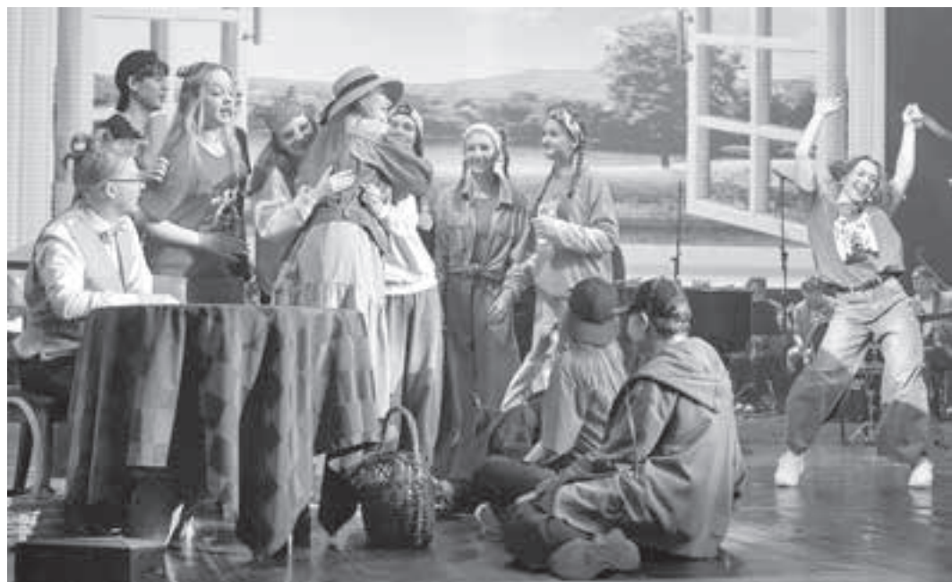
■ Фото Государственной филармонии Кузбасса имени Б. Т. Штоколова.