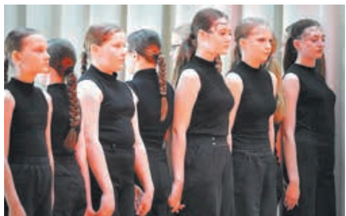
■ Фото из личного архива Анны Чарыкиной.