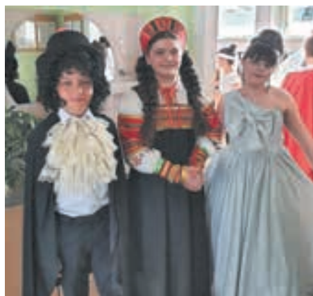
■ Артисты «Маленького театра».