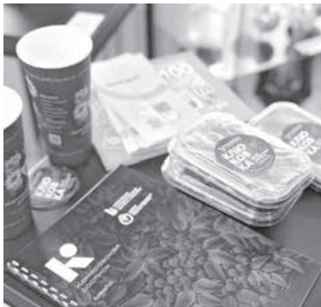
■ Фото Сергея Шпица.