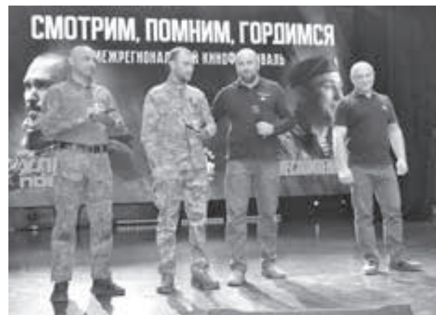
■ Фото Государственного фонда «Защитники Отечества».

Особенность этих работ – в их подлинности. Ветераны специальной военной операции участвовали в соз-