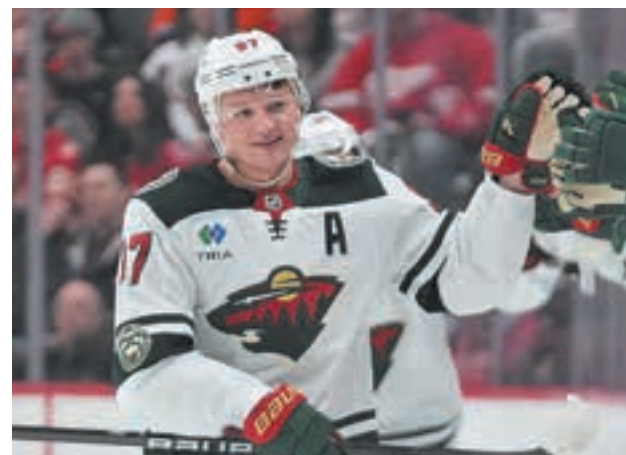
Кирилл Капризов – единственный кузбасский хоккеист, продолжающий борьбу за Кубок Стэнли в этом сезоне.