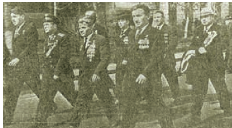
Идут ветераны Великой Отечественной войны.