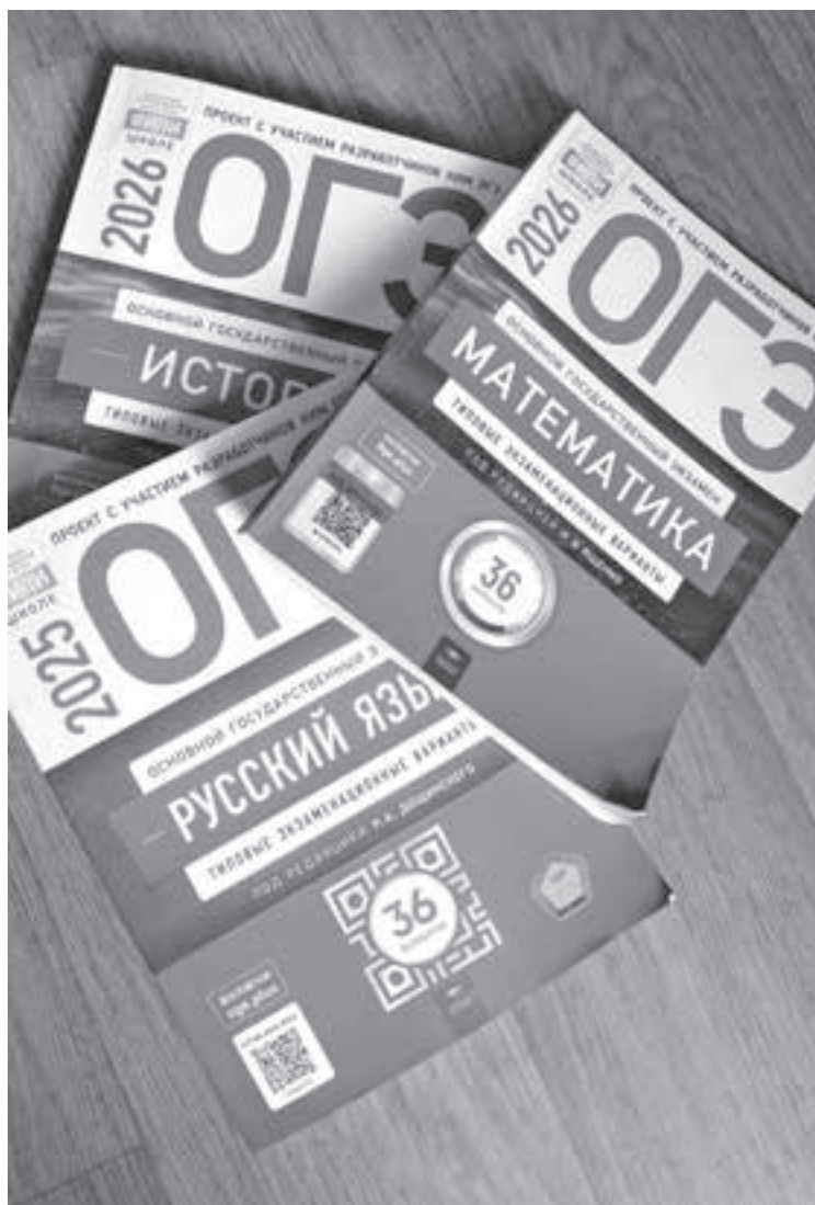
■ Фото автора.