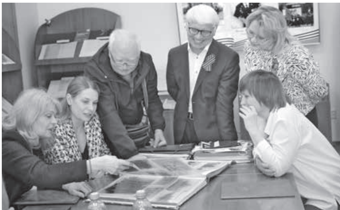
■ Фото автора.