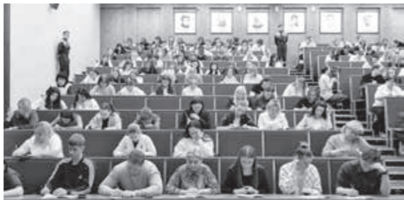
Международный экологический диктант – ежегодная просветительская акция для повышения уровня экологической грамотности и вовлечения граждан в природоохранную деятельность.