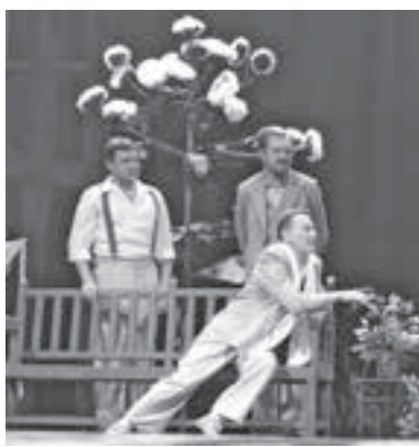
Фото Проклопьевского драмтеатра.