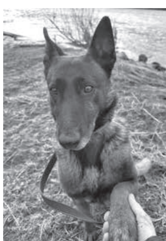
Бельгийская овчарка Николь.

Для Николь выбрали надёжные и заботливые руки. Проводы прошли в торжественной обстановке. Под аплодисменты коллег овчарка ушла в новую жизнь с новой хозяйкой.