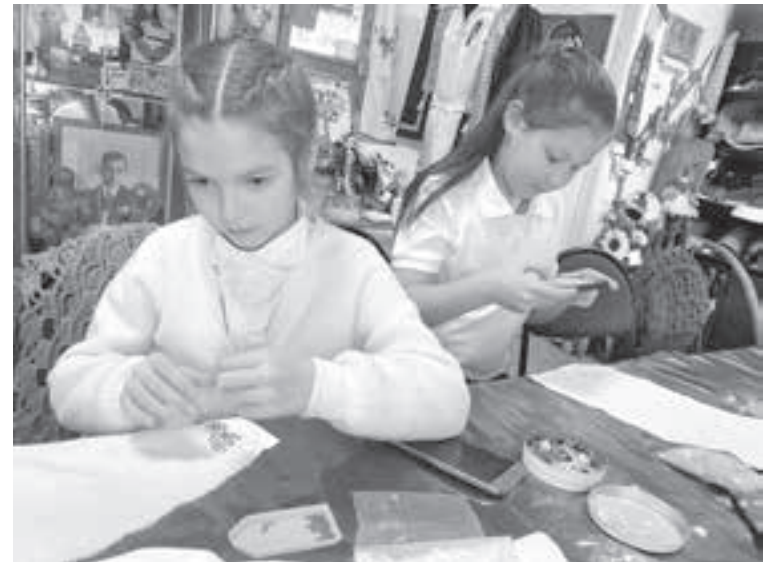
Гости комнаты принимают участие в мастер-классах, знакомясь с традиционными видами рукоделия татар.

Уютный уголок родной культуры стал местом притяжения для татар не только из Кемерова, сюда с удовольствием едут и из других городов Кузбасса. Здесь проводят мастер-классы, уроки по татарскому языку и просто дружеские встречи. И каждый здесь делает большой вклад в общее дело.