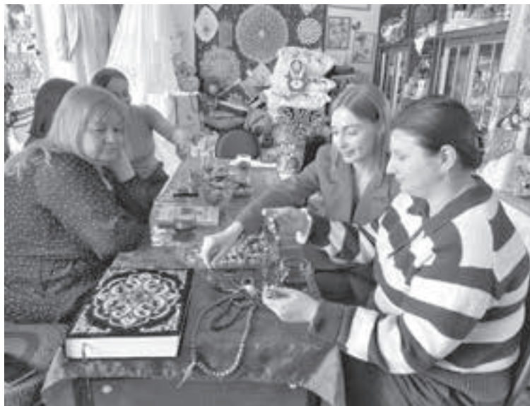
В коллекции национальной комнаты татарского быта более 400 экспонатов, за каждым из которых стоит чья-то история жизни.

«Вот вместе с рушниками у нас висит вышитое полотенце. На самом деле это портянка. Повесила я её сюда вначале по незнанию, а потом оставила на виду, сильно уж красивая и уникальная вещь. Принесла её беловчанка, прапрабабушка которой, отправляя мужа на войну, вышила супругу такие портянки. Они стали настоящей реликвией для их семьи. Вещицу эту решили передать нам, чтобы сохранить уникальную историю, – рассказывает руководительница комнаты. – Вот висит гармоника. Это 1935 год, сзади есть надпись: «Казанская фабрика гармоний». Я ездила за ней в Белово. Пожилая женщина, дарившая нам, боялась, что дети после её смерти выкинут на помойку этот инструмент. А ведь гармошечка ещё отлично работает, вот только играть на ней никто из активистов музея не умеет».