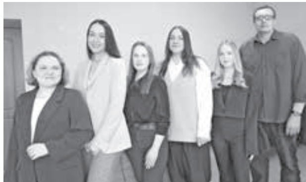
Коллектив пресс-службы Министерства образования Кузбасса.

Повестка формируется вокруг актуальных федеральных и региональных инициатив. В прошлом году, когда вся страна отмечала 80-летие Победы в Великой Отечественной войне, министерство провело кампанию, основанную на едином визуальном оформлении и офици-