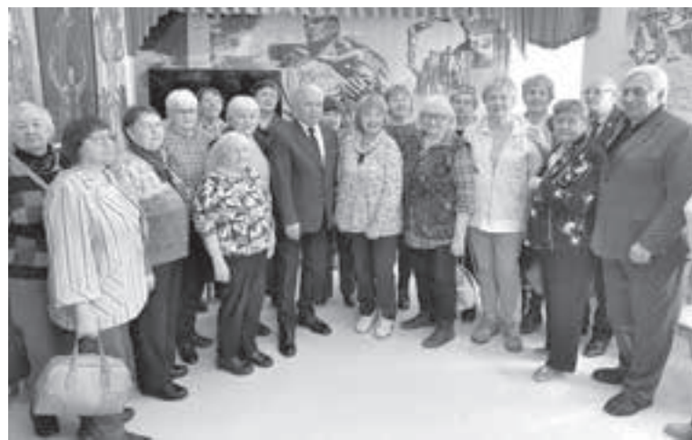
■ Фото Т. Бучилиной.

Л. Г. Лекомцева, пресс-центр Кемеровской городской общественной организации ветеранов.