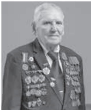
■ А. М. Терехов.