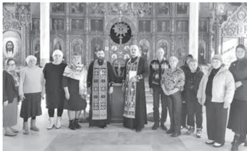
■ Фото фонда «Защитники Отечества».