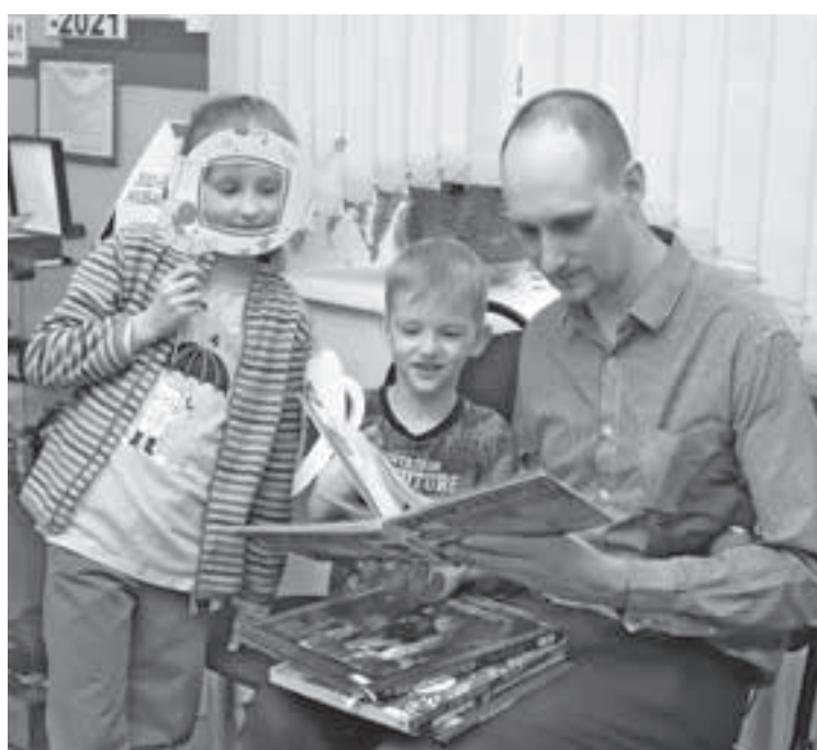
■ Фото Государственной библиотеки Кузбасса для детей и молодёжи.

Центральная городская библиотека Киселевска готовит уникальный культурный проект – фестиваль искусств «Народные ритмы большой страны». Это яркое событие состоится 17 апреля и позволит каждому ощутить дух многогранной русской культуры, её богатство и глубину. Путешествие в мир народной культуры начнётся с самого порога библиотеки, которая на вечер преобразится в традиционную русскую избу, чтобы каждый гость смог прочувствовать уклад жизни предков. Встреча посетителей пройдет в сених, создавая атмосферу гостеприимства и предвкушения праздника. Отсюда нити истории поведут гостей в сердце фестиваля – горницу, где развернётся основная инсценированная программа, раскрывающая богатство русских традиций. Также на сцене фестиваля мастерство представят почтенные представители армянской диаспоры; яркий чувашский фольклорный ансамбль «Хелхем»; самобытный ансамбль татарской песни «Чулпан»; энергичная шоу-группа «Русский размах»; образцовый самодеятельный коллектив ансамбль танца «Академия». Для тех, кто предпочитает творить своими руками, фестиваль переместится в уютную светлицу. Здесь специалисты библиотеки проведут эксклюзивные мастер-классы, объединяющие древние символы и современное творчество. Завершающим штрихом праздника станет посещение тематической фотозоны «Традиции в кадре».