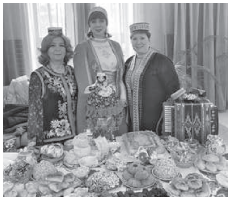
Участие в выставке этнокультурного проекта «Ассамблея народов России» в рамках открытия Года единства народов России в Кузбассе.