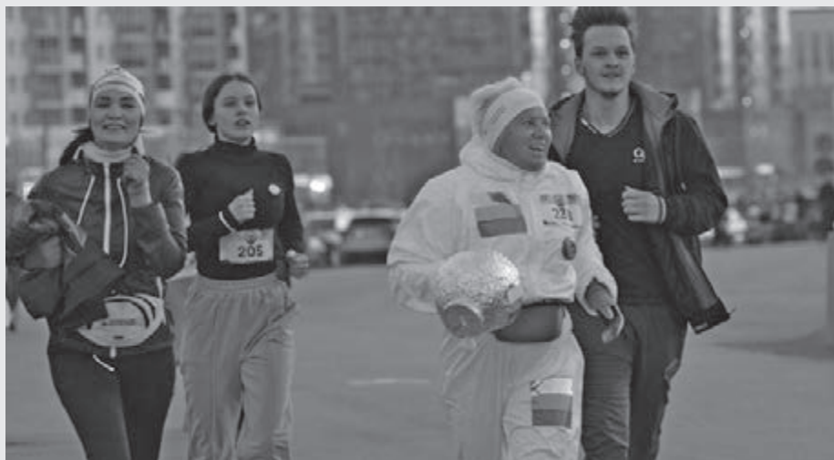
■ Фото Анастасии Белоусовой.

Соперником новокузнецчан на этой стадии турнира стал «Горняк-УГМК» из Верхней Пышмы. В решающем, седьмом матче серии 1/8 команда из Свердловской области на своём льду одержала волевую победу над пермским «Молотом» со счётом 2:1.