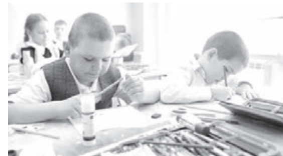
■ Фото Константина Полюцкого.