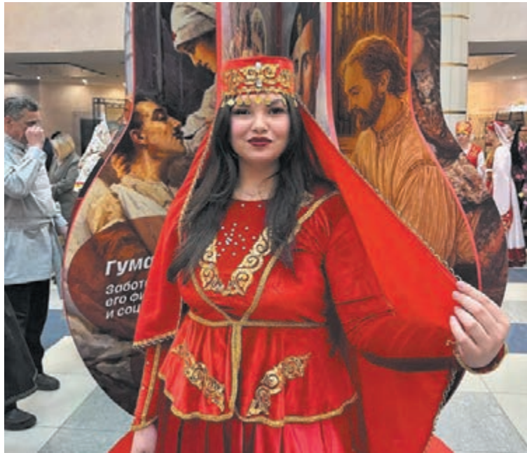
■ Фото из личного архива героини публикации.

Молодёжь видит: у разных народов много общего.