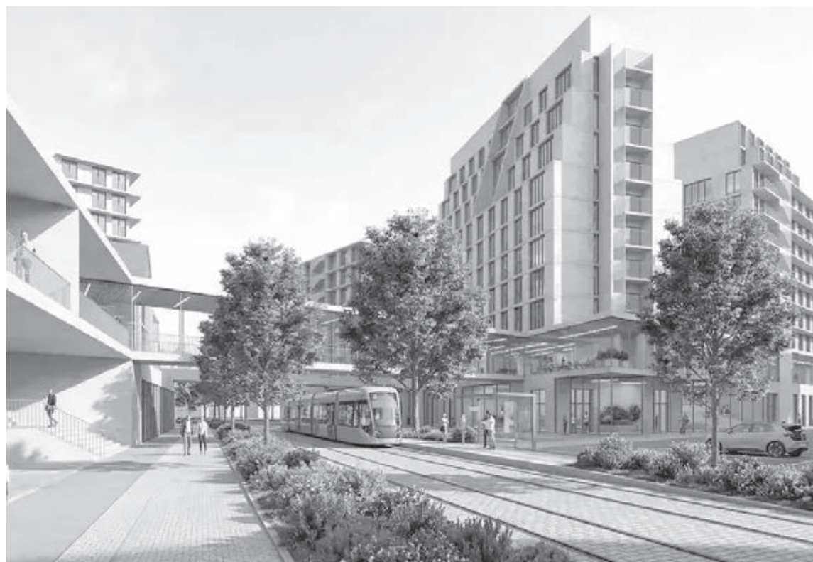
■ Примерно так будут выглядеть первые дома нового инновационного кластера.