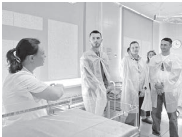
■ Вместе с беременными женщинами в тематических мероприятиях участвовали и будущие отцы.

Параллельно в учреждениях социального обслуживания семьи и детей Кузбасса прошли лекции, беседы с врачами, индивидуальные консультации. Специалисты рассказывали о действующих мерах поддержки, а для создания праздничной атмосферы организовали творческие мастер-классы по изготовлению семейных