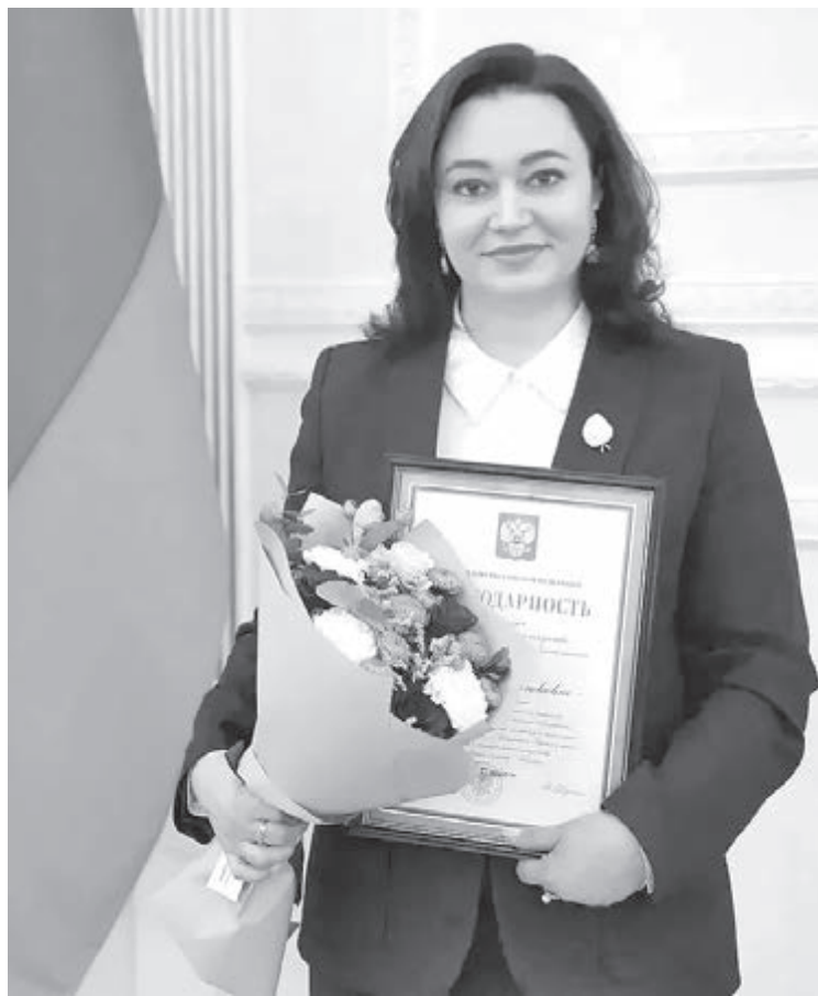
■ Фото из личного архива Марины Межовой.

Отдельный повод для гордости – победы наших студентов на профессиональных кон-