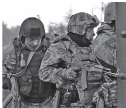
■ Фото Росгвардии Кузбасса.