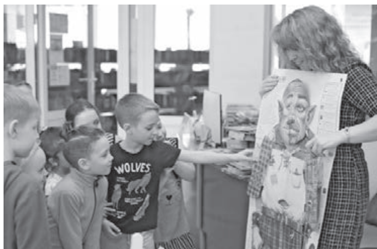
■ Фото предоставлено Государственной библиотекой Кузбасса для детей и молодёжи.

Неделя детской книги – это событие, которое помогает в очередной раз напомнить взрослым о том, что книга играет важную роль в развитии ребёнка, что всё начинается с детства. А детям оно помогает через все возможные формы показать книжное богатство библиотек.