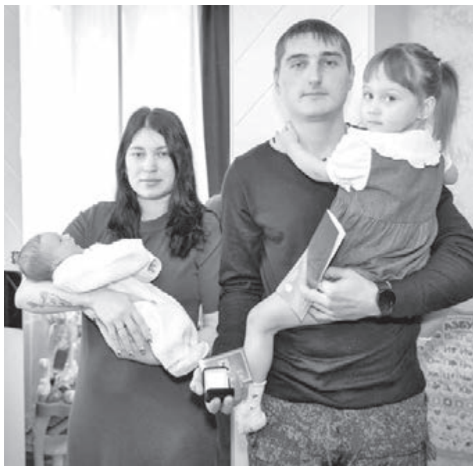
■ Семья Куликовых.

В Юрге родителям малышей, появившихся на свет в праздничные даты, вручают памятные медалы. Когда дети подрастут, то смогут носить их как оберег или особый знак, который в будущем вполне сможет претендовать на статус семейной реликвии.