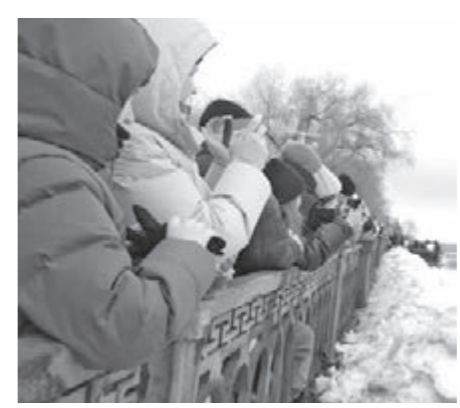
В Кемерове перед вскрытием Томи подорвали лёд у опор моста.