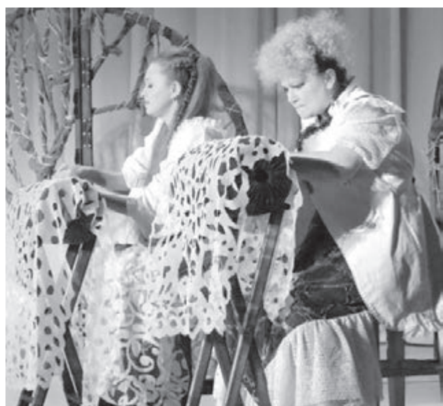
■ Фото Кемеровского театра для детей и молодёжи.