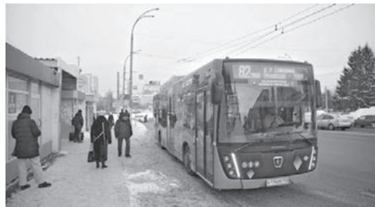
■ Фото Сергея Шпица.

И раз уж речь зашла про различные способы рассчитаться за проезд, стоит обратить внимание на акцию от Национальной системы платёжных карт (НСПК). Согласно ей, с 1 марта по 30 июня этого года жители Кузбасса могут сэкономить восемь рублей на поездках в общественном транспорте при оплате любой банковской картой платёжной системы «Мир», загруженной в смартфон. А если карта зарегистрирована на региональном портале госуслуг vuzbasse.rf , проезд будет стоить на десять рублей дешевле.