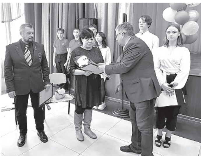
■ Фото медицентра школы № 26 #Вектор26 г. Междуреченска.

МТУ ФАУГИ в Кемеровской области – Кузбассе и Томской области в лице ООО «ГАРАНТ», ИНН 4205430964, ОГРН 1254200010680, действующего на основании государственного контракта от 19.11.2025 г. № 0139100005225000037, сообщает о проведении торгов в форме открытого аукциона по продаже арестованного имущества по следующим лотам: