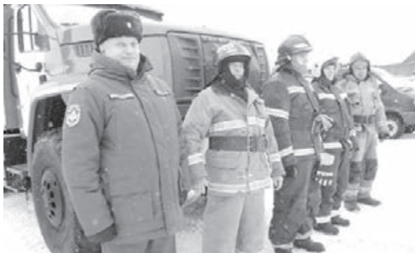
■ Фото с сайта администрации правительства Кузбасса.

В Анжеро-Судженске коммунальные службы рассчитали подъездные пути к озёрам Победа, Мишиха, Первый Алчедат, Второй Алчедат. В ближайшее время состоится осмотр дамб, чтобы определить, где необходима отсыпка и уплотнение. Будет проведена вырубка растительности, затрудняющей проход воды в руслах рек.