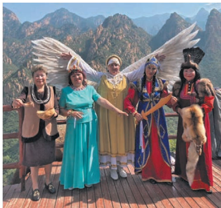
■ На фестивале в Китае.

В 1990 году ансамблю «Чылтыс» было присвоено звание «Народный». Какое-то время коллектив занимался в ДК «Топлаз». А сейчас – в ДК «Горняк». Поначалу в ансамбле было около 30 человек. Сейчас – 15. Тем не менее коллектив сохранил костяк и ему удаётся справляться с большим количеством задач.