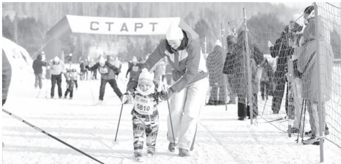
■ Фото пресс-службы администрации правительства Кузбасса.

состоится 14 февраля и будет посвящена Году единства народов России. Регистрация подходит к концу, но успеть ещё можно. Для этого нужно зайти на портал «Госуслуги», перейти в раздел «Массовые спортивные соревнования» и найти нужное событие. Далее необходимо выбрать место старта, и система автоматически подгрузит паспортные данные и сведения о полисе обязательного медицинского страхования. Если данные не подтянутся, их придётся ввести вручную. После этого нужно следовать инструкциям на экране, заполнить контактные данные и дождаться уведомления об успешной регистрации. Современные технологии позволяют не приносить на старт паспорт и полис ОМС, достаточно предъявить их на экране смарт-