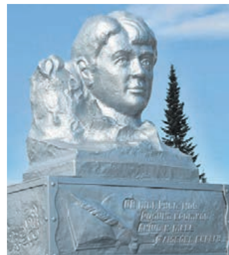
Один из объектов инициативного бюджетирования в регионе – памятник Сергею Есенину.

Для участия в конкурсе необходимо создать инициативную группу из не менее 10 участников в возрасте от 18 лет и представить проект в местную администрацию. Также заявителями могут выступать старосты или органы территориального общественного самоуправления (ТОС).