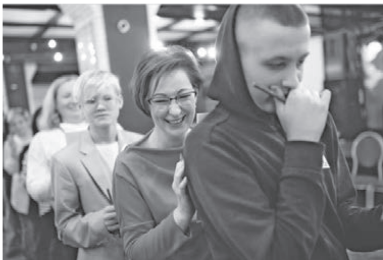
■ Наставники вместе с подопечными принимают участие в тренингах, чтобы лучше узнать друг друга.