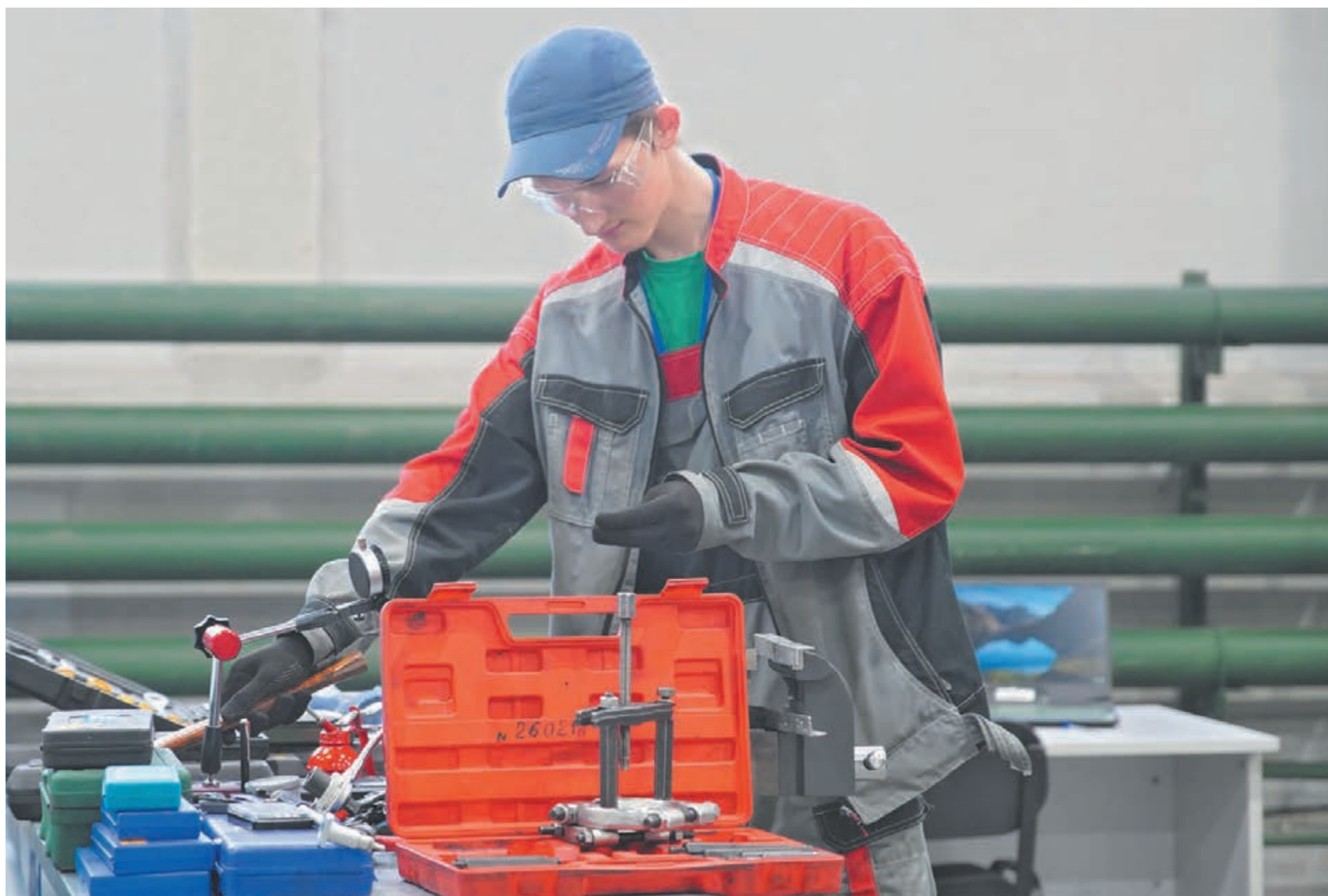
■ В мастерских создана современная образовательная среда, максимально приближенная к профессиональной практике.