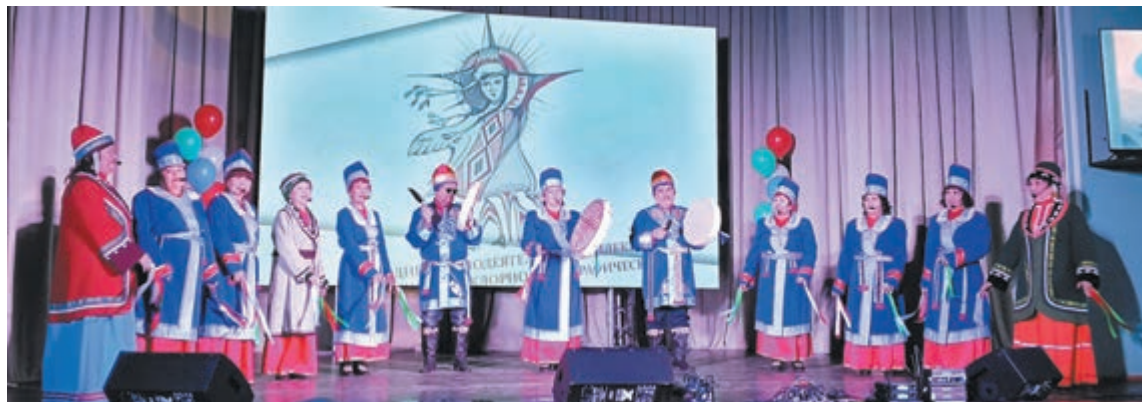
■ Выступление на концерте в честь 40-летия ансамбля.

Вот уже 40 лет народный самодеятельный коллектив, шорский фольклорно-этнографический ансамбль «Чылтыс» сохраняет традиции коренного народа. За эти годы коллектив приобрёл широкую популярность не только в Кузбассе и России, но и за рубежом