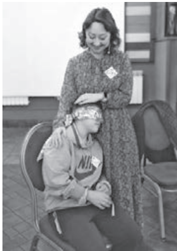
■ Самое ценное, что может дать наставник подростку, – эмоциональная поддержка в трудных ситуациях.