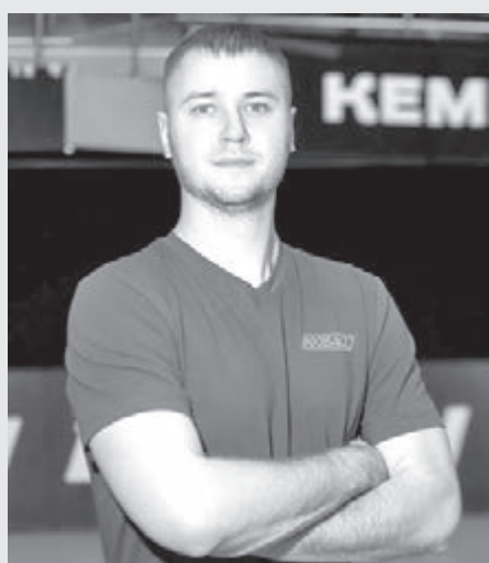
■ Фото пресс-службы ВК «Кузбасс».

ный округ) стартовал чемпионат России по муай-тай. Соревнования продлятся до 15 февраля. Это первое в истории первенство страны, которое проводится за пределами Северного полярного круга. Также важной особенностью нынешнего чемпионата является то, что в нём участвуют только взрослые спортсмены в возрасте от 17 до 40 лет (как мужчины, так и женщины).