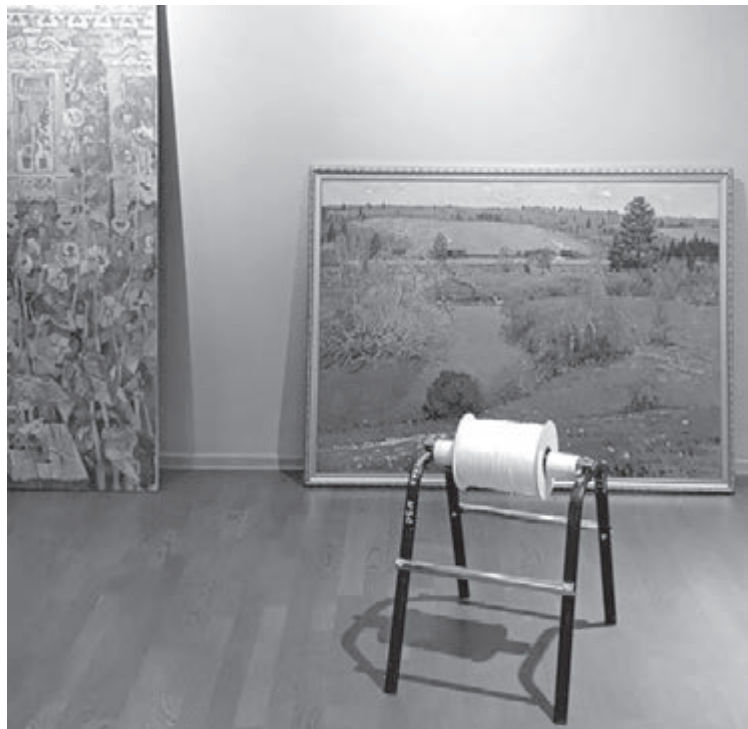
■ Подготовка к открытию выставки.

рамках регионального социокультурного просветительского проекта «Мы – Россия. 17 ценностей», инициированного Министерством культуры и национальной политики Кузбасса.