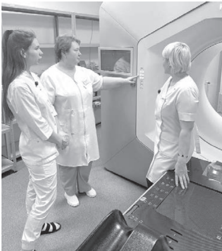
■ Обязательно проходите диспансеризацию по месту жительства – это может спасти жизнь.