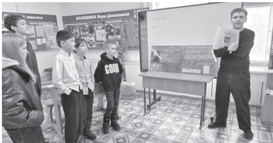
Фото школьного народного музея школы № 12 имени В. Д. Волошиной.