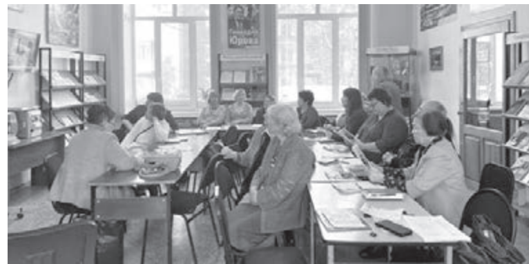
■ Фото Н. П. Осиповой.

В библиотеке имени Г. Е. Юрова (Рудничный район Кемерово) прошёл методический сбор наставников по теме урока города, посвящённой выдающемуся поэту и прозаику Кузбасса.