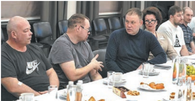
■ Фото пресс-службы администрации правительства Кузбасса.

Как сообщила пресс-служба администрации правительства Кузбасса, ряд обращений носил