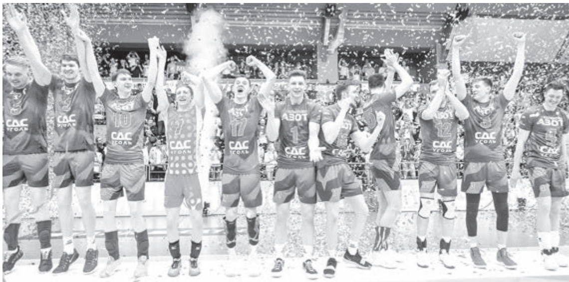
■ Чемпионство-2019 стало первым и пока единственным в истории кемеровского клуба.