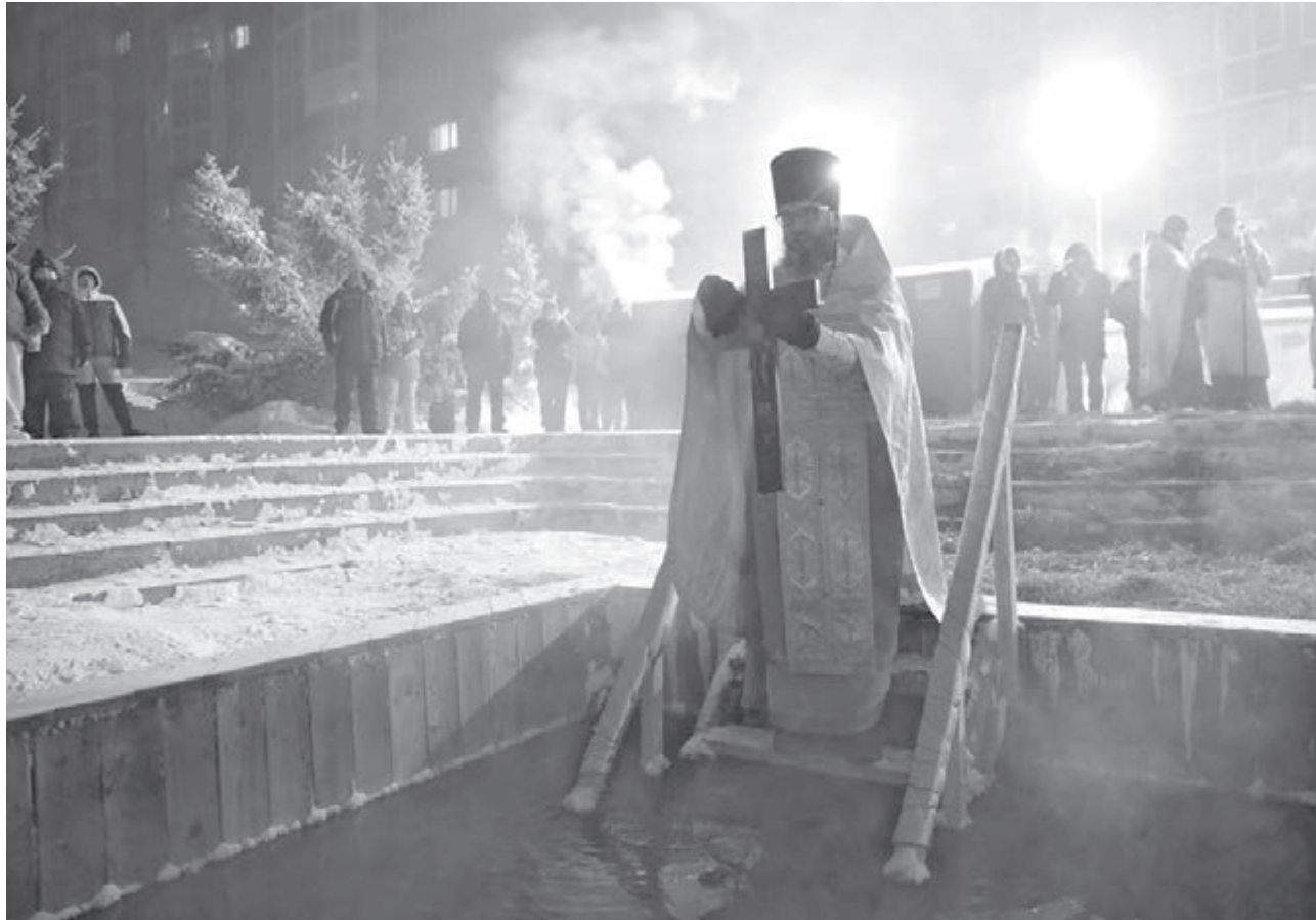
■ БОДРЯЩАЯ ТРАДИЦИЯ. Сильный мороз не испугал кузбассовцев, желающих окунуться в освящённую воду в дни крещенских купаний 18 и 19 января. У прорубей дежурили сотрудники МЧС, медики, полицейские и волонтеры. В храмах прошли праздничные богослужения.