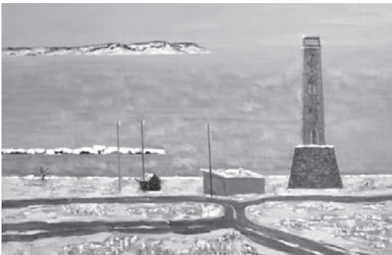
Фото Кузбасского центра искусств.

Работы Белокриницкого находятся в областных музеях изобразительного искусства Омска, Барнаула, Новосибирска, Томска, Кемерова, Новокузнецка, Красноярска, а также в музее современного российского искусства города Харбина КНР, в частных коллекциях разных стран: Германии, Хорватии, Чехии, США, России, КНР, Израиля. Творческая деятельность художника многократно отмечена наградами правительственных и общественных организаций, среди которых Российская академия художеств, Министерство культуры Российской Федерации, Министерство культуры и национальной политики Кузбасса.