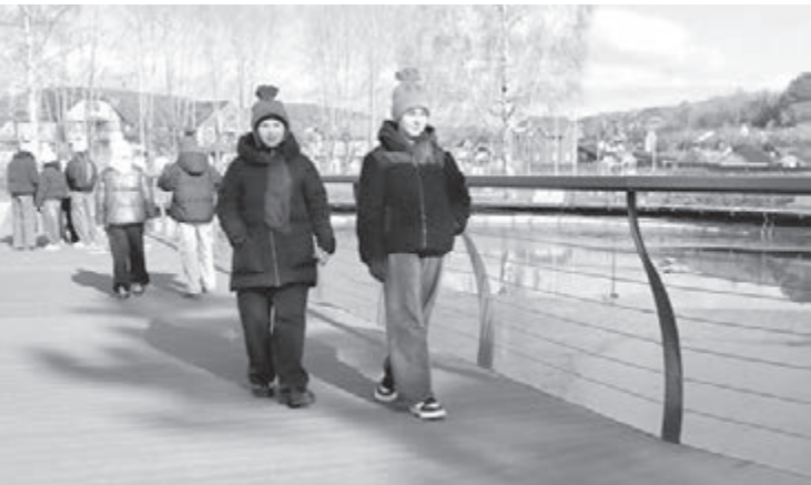
Новый парк на улице Горького в Калтане – один из победителей Всероссийского конкурса лучших проектов создания комфортной городской среды прошлых лет.

«В 2025 году для развития федерального проекта «Формирование комфортной городской среды» нацпроекта «Инфраструктура для жизни» мы расширили возможности участия регионов во всероссийском конкурсе объектов благоустройства.