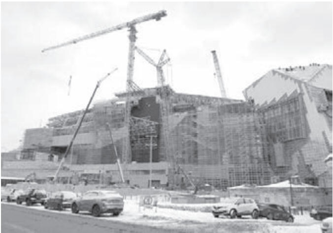
■ Завершение строительства музейно-театрального комплекса станет важным событием культурной жизни Кузбасса.