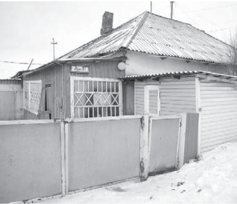
■ Фото Сергея Шпица.

жет прогрессировать стремительно и зачастую необратимо. Особенно опасно оно для людей с хроническими болезнями дыхания, вейп может стать для них смертельным.