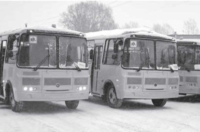
■ Фото Анастасии Белоусовой.