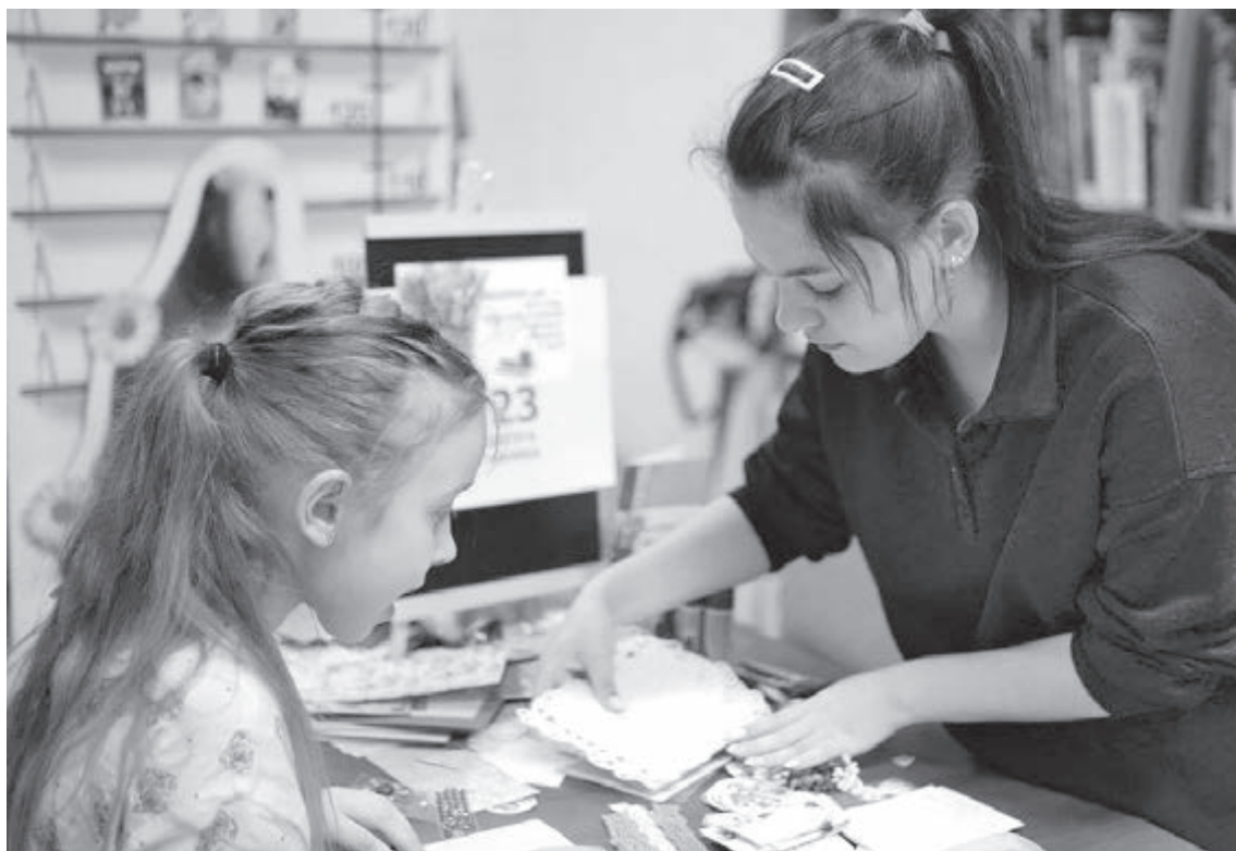
■ Фото Государственной библиотеки Кузбасса для детей и молодёжи.