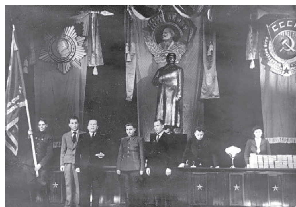
Вручение ордена Кутузова I степени коллективу КМК. 1945 г.

году Сталинскую премию, он значительную её часть передал в Фонд обороны на изготовление 400 автоматов бойцам Сибирской добровольческой дивизии. Потом в знак благодарности ему был вручён гвардейский значок, тем самым он был вписан в героическую историю этого воинского соединения.