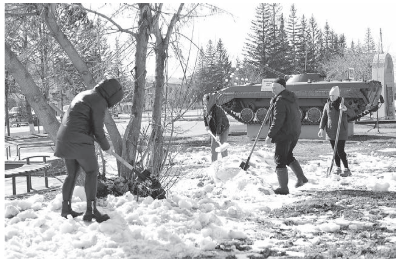
ГОТОВИМСЯ К ДНЮ ПОБЕДЫ. Более 100 тысяч человек приняли участие в первом с начала года Всекузбасском субботнике. Он прошёл по поручению губернатора Кузбасса Илья Середюка. По традиции весенняя уборка будет проходить каждую пятницу до конца апреля. В этом году Всекузбасский субботник посвящён 80-летию Победы, поэтому особое внимание уделяется приведению в порядок памятных мест, посвящённых участникам Великой Отечественной войны.