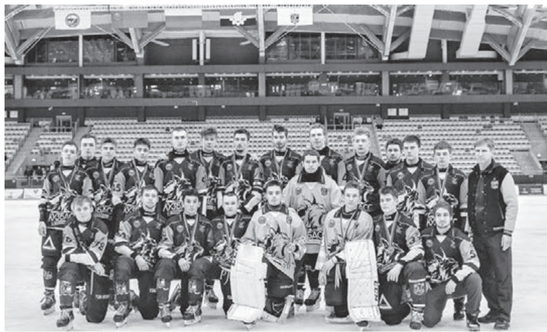
■ «Кузбасс-2» – серебряный призёр всероссийских соревнований в высшей лиге.