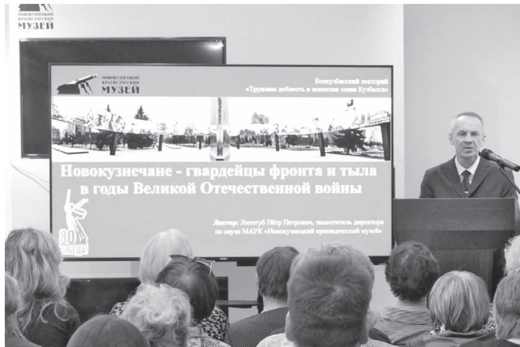
Лекторий в Новокузнецком краеведческом музее.