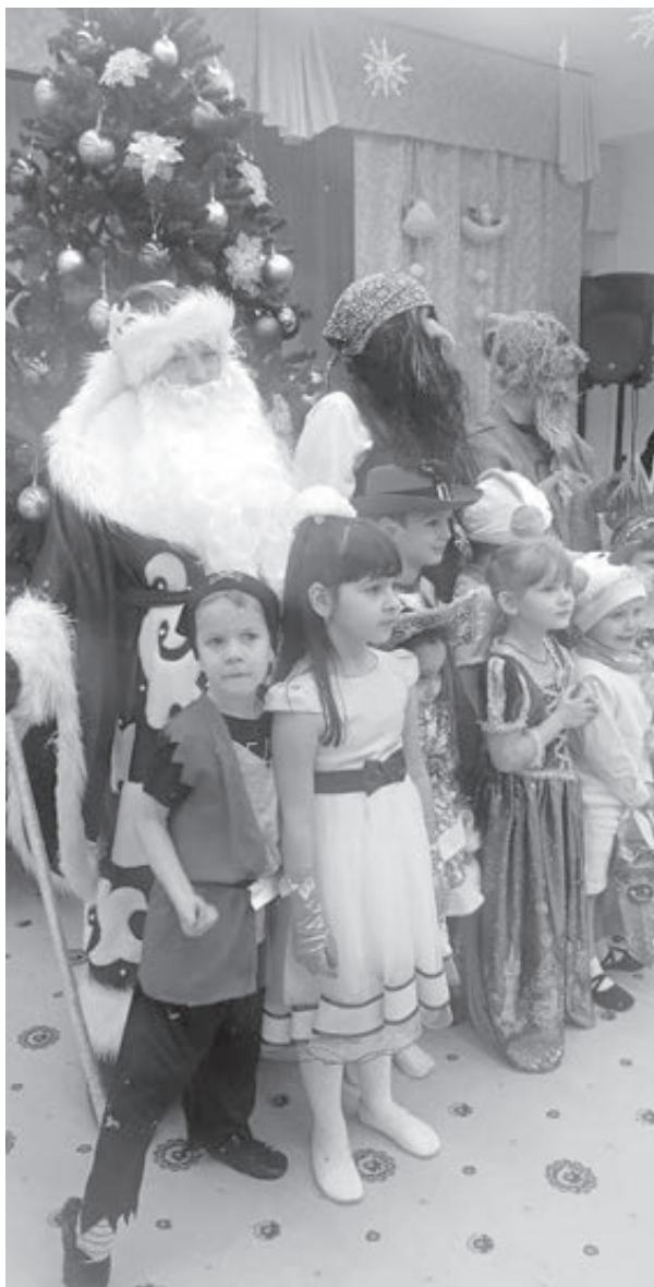
■ Фото автора.

5. День утренника настал. Подготовьте костюм и всё необходимое заранее, чтобы ничего не забыть. Перед