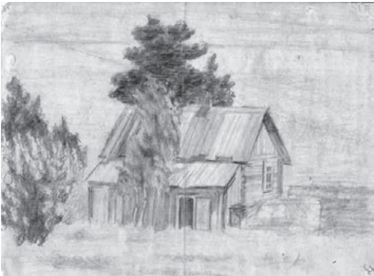
■ Письма, эскизы и фотография – из фондов Государственного архива Кузбасса.