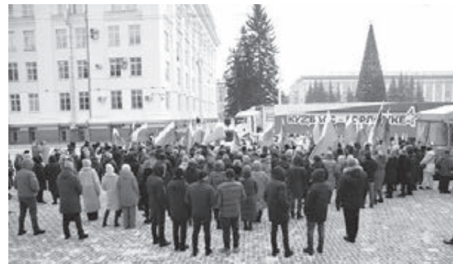
■ Фото Савелия Баширова.