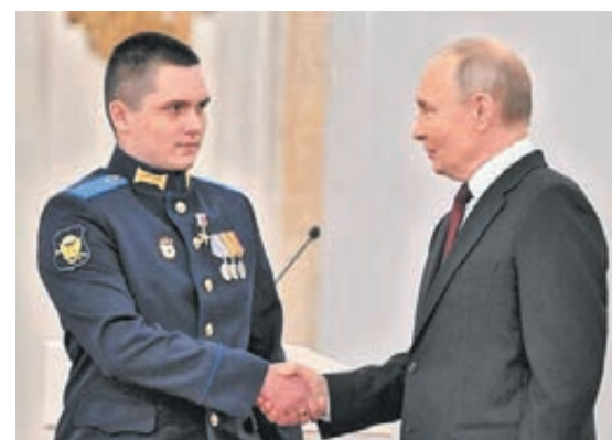
■ Фото с сайта администрации правительства Кузбасса.