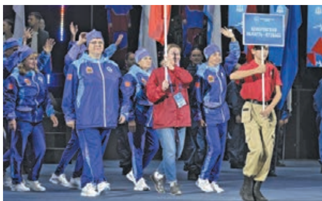
■ Фото Анастасии Белоусовой.