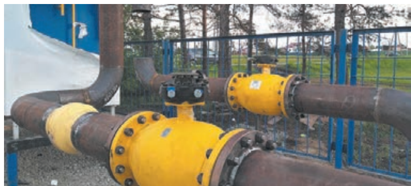
■ Фото с сайта администрации правительства Кузбасса.