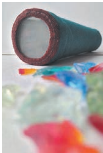
■ Фото автора.