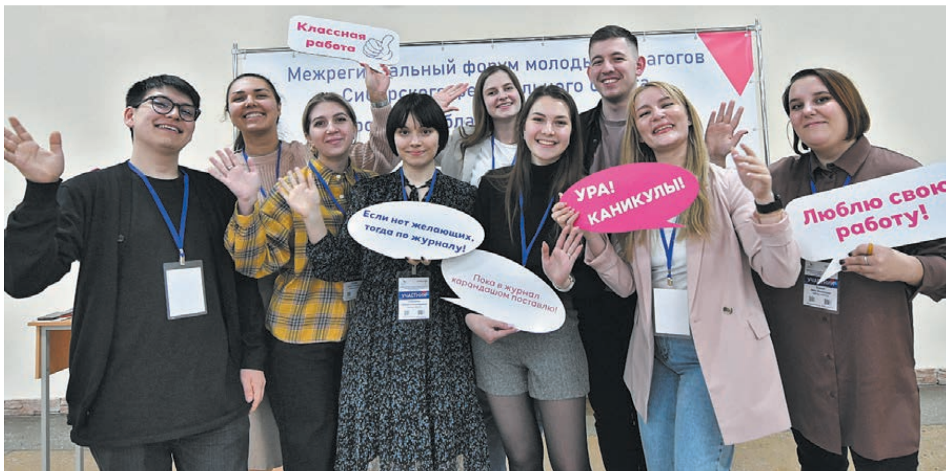
■ Фото Александра Павлова.