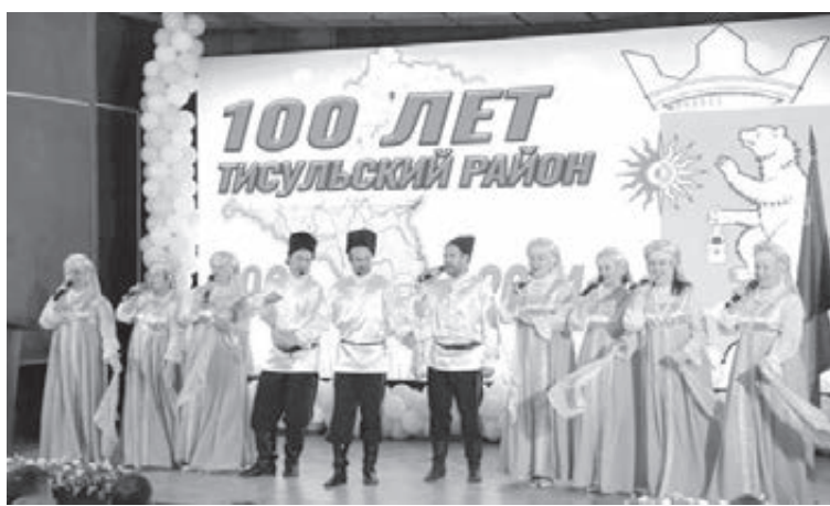
■ Перед награждением в честь юбилея округа состоялся праздничный концерт местных творческих коллективов.

«Здесь в зрительном зале – 250 посадочных мест. Культура у вас богатая, есть кому выступить, показать таланты. То, что такое здание не используется, нехорошо. Состояние помещений – плачевное, надо понять: