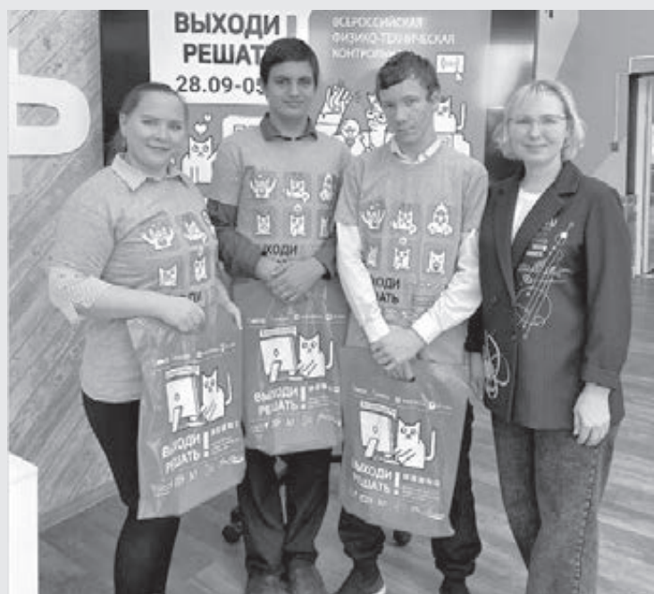
■ Фото Центра опережающей профессиональной подготовки Кузбасса.