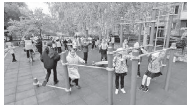
■ Фото с сайта администрации г. Кемерово.