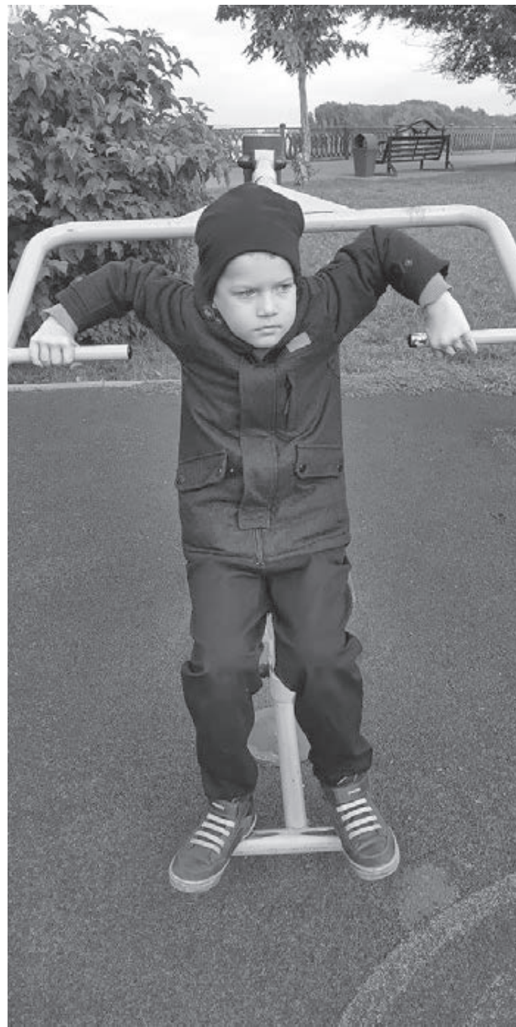
■ Прогулка на свежем воздухе – самый доступный способ укрепить иммунитет.

сковать, что из-за ОРВИ проба может быть немного искажена. И если у вашего ребёнка по результатам пробы Манту или диаскинтеста врач выявил отклонения, то обязательно отправят к фтизиатру. В таком случае нужно пройти осмотр фтизиатра и дополнительные обследования без тревог и паники. Старайтесь вовремя прививать детей и прививаться сами. Вакцинация продолжает спасать жизни.