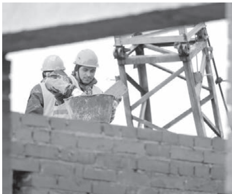
■ Первый за последние 15 лет новый многоквартирный дом в Тисуле сдадут в следующем году.