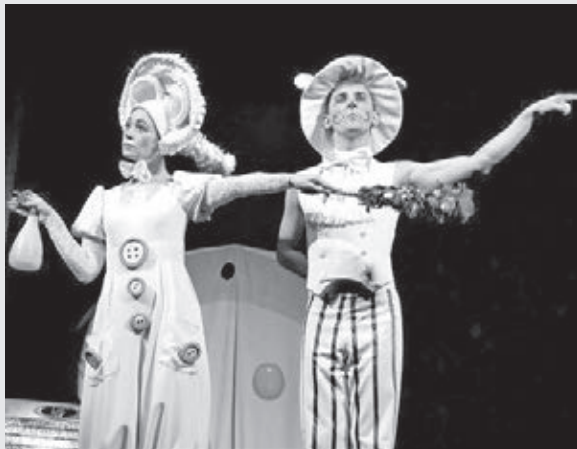
■ Сцена из спектакля «Все мыши любят сыр».

1 ноября – «Воспитанный призраками» (12+). История двух подростков, которые по воле судьбы встретились на кладбище. Почему они оказались в этом месте, что привело их сюда, от кого они бегут, почему они хотят быть одни? Бегут ли они от родителей, погружённых в вечное выяснение отношений, или от проблем в школе, а может, бегут от ре-