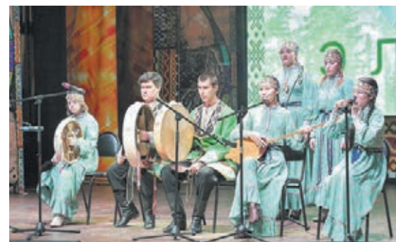
■ Фото с сайта администрации правительства Кузбасса.