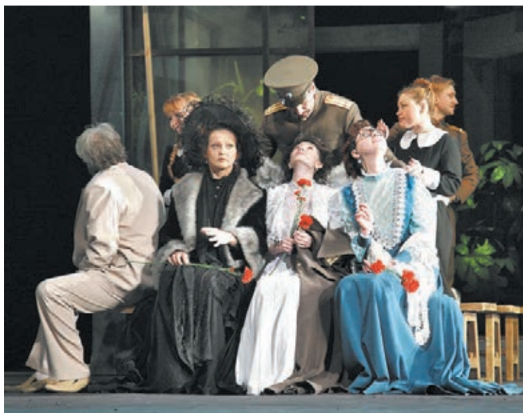
■ Сцена из спектакля «Три сестры».

Большое событие – гастроли в 1981 году в Москве. На сцене Малого театра СССР кемеровчане показали пять своих спектаклей. Борис Соловьёв, заслуженный деятель искусств РСФСР, народный артист России, более двух десятилетий возглавлял Кемеровский театр драмы. С 1973 года Борис Нифантьевич был главным режиссёром, а в