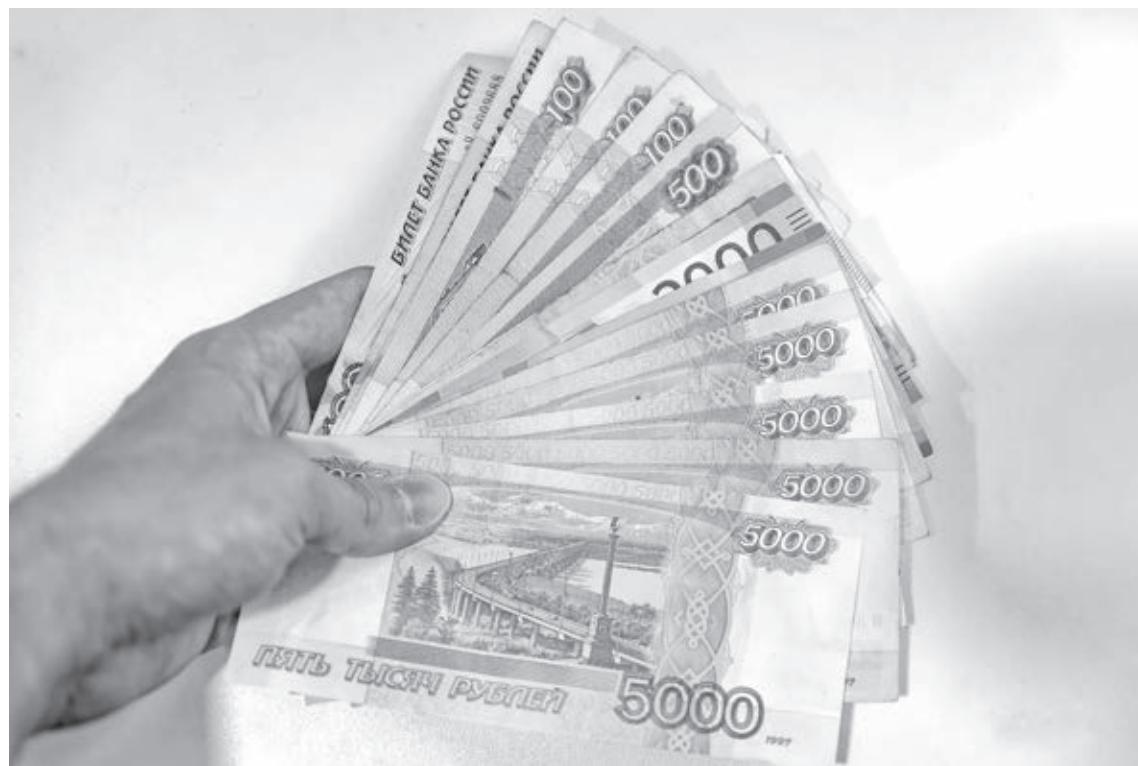
■ Фото Сергея Шпица.

Главное отличие ПДС от других накопительных программ – господдержка. В течение десяти лет государство будет софинансировать взносы – максимально