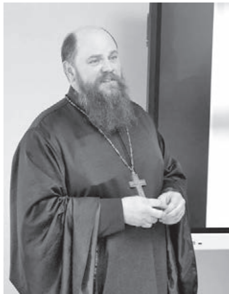
■ Фото Татьяны Фетисовой.

В организации и проведении мероприятия приняли участие представители Регионального отделения Международной