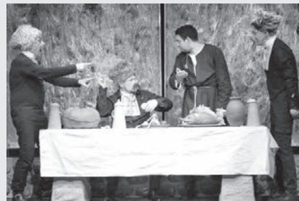
Полосу подготовила Анна Тимошук.

«Вий» – произведение легендарное. И, видимо, поэтому оно претерпело множество трактовок, интерпретаций. В постановке постарались крайне бережно отнестись к гоголевскому тексту и сюжету, лишь укрупнив те моменты и события, которые говорят о главном. Это разговор об истинной вере, ведущей человека к духовным высотам, и вере поверхностной, «попсовой», ограниченной знанием молитв и ношением атрибутов. Это исследование малых обрывков мифа о Вие, судьбе и стороже. Эта история ждёт своего зрителя – думающего, ищущего, желающего видеть больше.