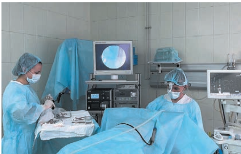
■ Фото с сайта администрации правительства Кузбасса.

Также в больницу поступили два операционных стола с электрогидравлическим приводом и расширенной функциональностью. Стоимость составила 3,6 млн рублей. Столы покрыты специаль-