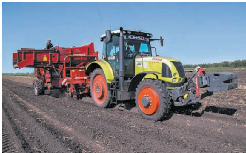
■ Фото с сайта администрации правительства Кузбасса.