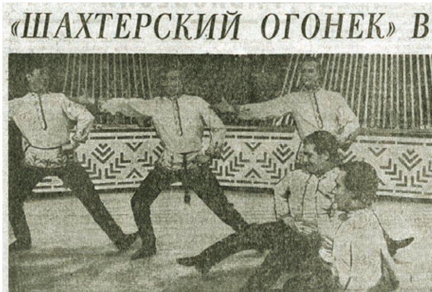
■ Выступление «Шахтёрского огонька» – танец «Жених».

Ансамбль показал тарасовцам программу, которую на днях смогли посмотреть по телевизору все кузбассовцы. Особенно отметили сельские зрители молодёжный танец «Сибирская енька». Его пришлось повторить. Два часа длился праздник молодости, задора и красоты.