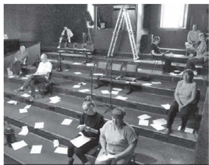
Фото Прокопьевского драмтеатра.

поместить героев в пространство пустоты. Чему удивятся зрители прокопьевской драмы? Узнаем в день премьеры.