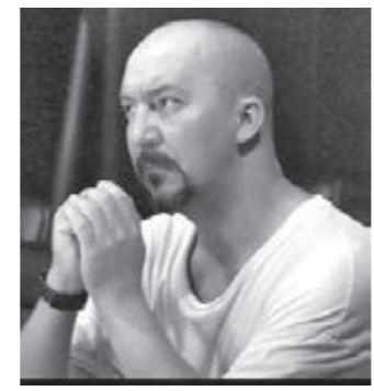
Режиссёр Евгений Лапшин.