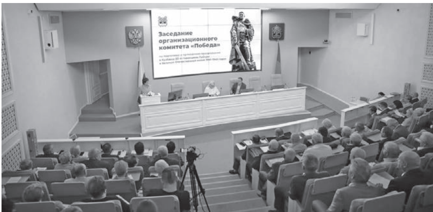
■ Фото Сергея Шпица.