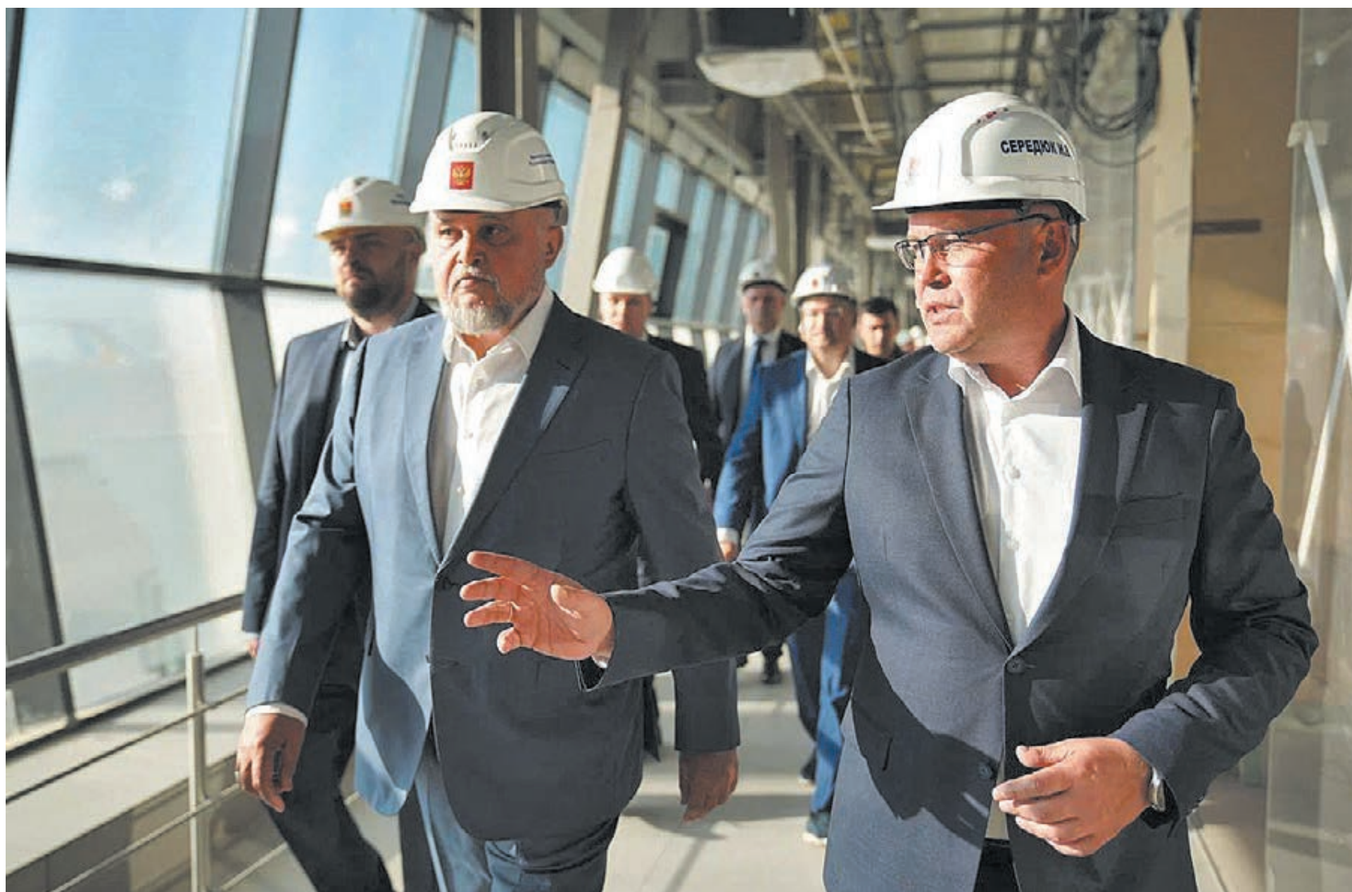
■ Фото Савелия Баширова.