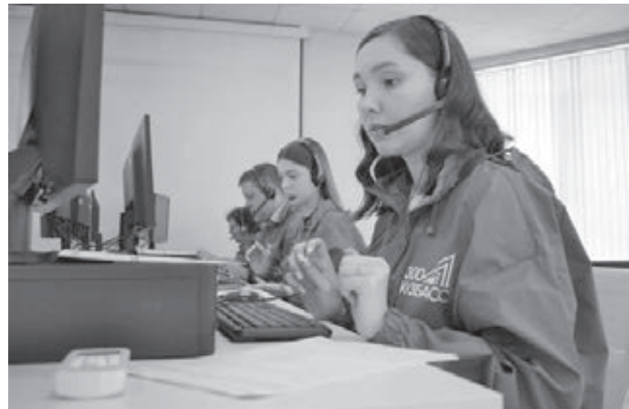
■ Фото Анастасии Белоусовой.

«Для меня это новый опыт. Перед началом нам провели инструктаж, как правильно беседовать, на какие вопросы