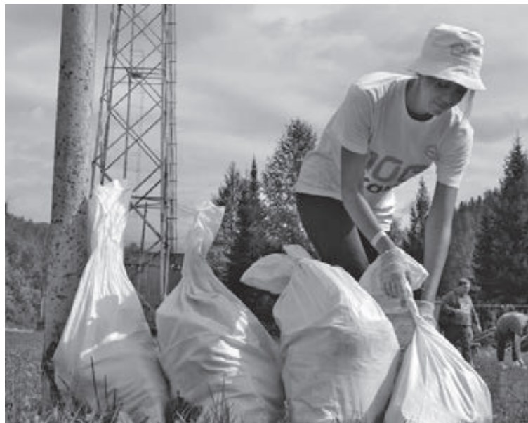
■ Фото Анастасии Белоусовой.