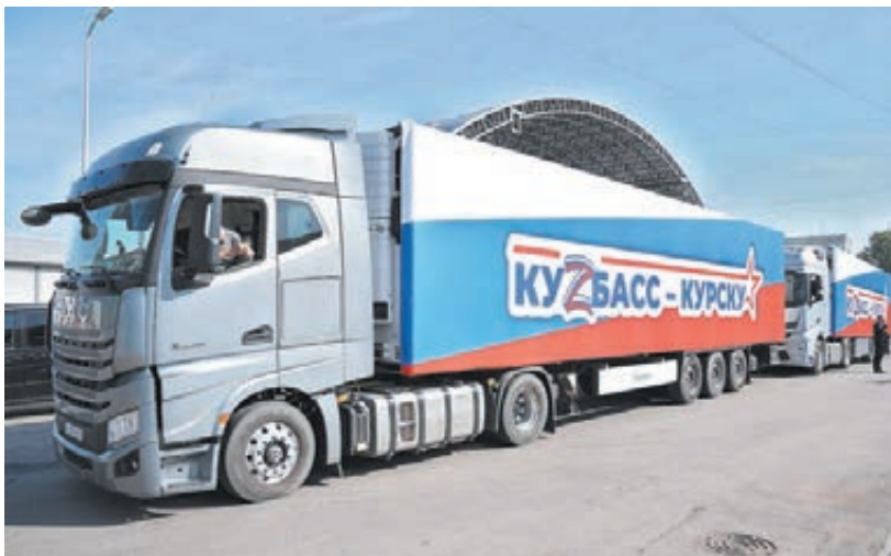
■ Фото Савелия Баширова.

«Люди ждут помощи, даже моральной, понимания, что они не одни, с ними вся страна. Это очень важно для жителей Курской области. И, конечно, они нуждаются во