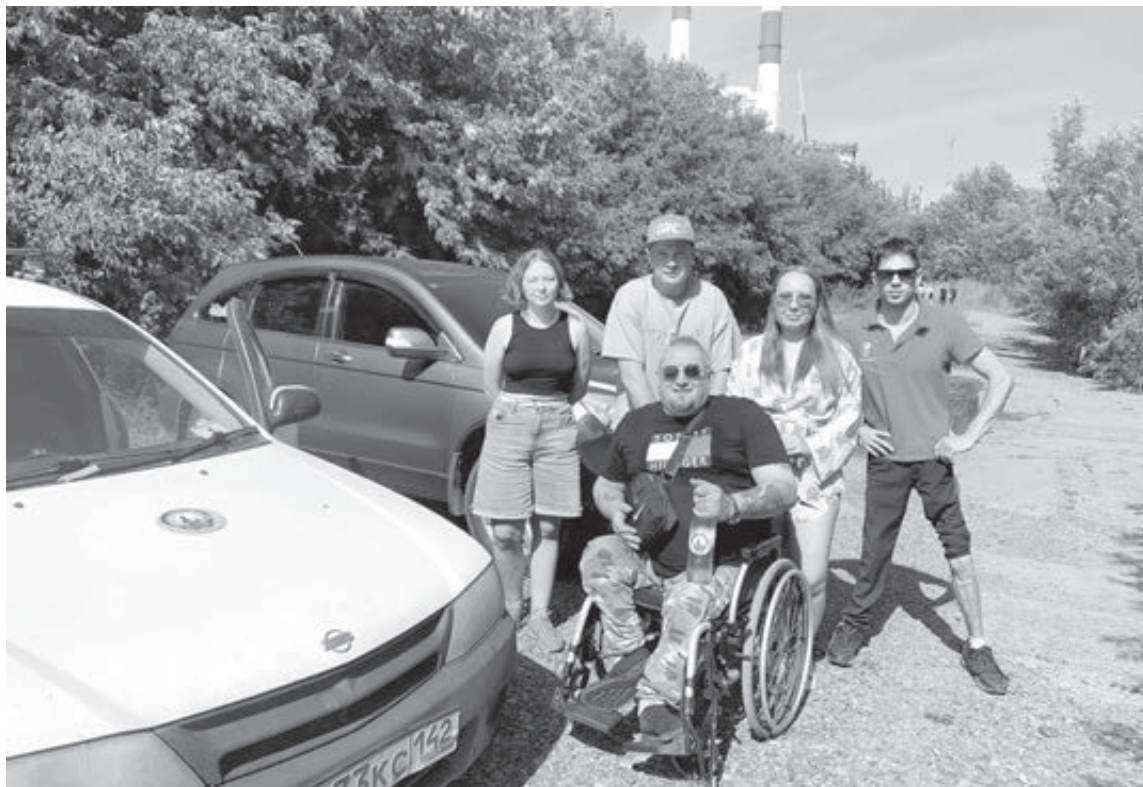
■ Команда участников автопробега начала своё путешествие с берега Томи в Кемерове. Здесь ребята набрали речной воды, которую позже вылили в Байкал.

Вылив воду Томи в озеро, кемеровчане набрали в бутылку байкальской воды, чтобы вылить её по возвращении домой в реку в Кемерове. Задачу свою честно выполнили и соблюли новую традицию, которую теперь возьмут за основу в будущих путешествиях.