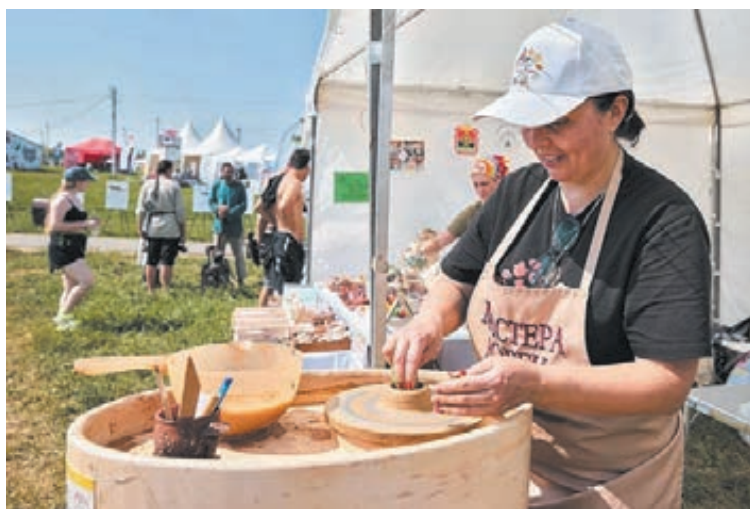
■ Фото со страницы Светланы Адаменко в соцсети «ВКонтакте».

«Весёлая ватрушка» дети сами делают настоящие ватрушки, а пока они выпекаются, они могут принять участие в познавательных мероприятиях и сделать, к примеру, из глины пиалу с отгисками, расписать тарелочки, смастерить подставки для карандашей из фанеры, а также порисовать сепией, сангиной или углем.