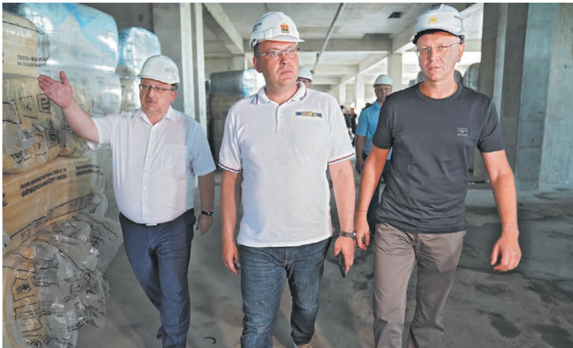
■ Фото Савелия Баширова.