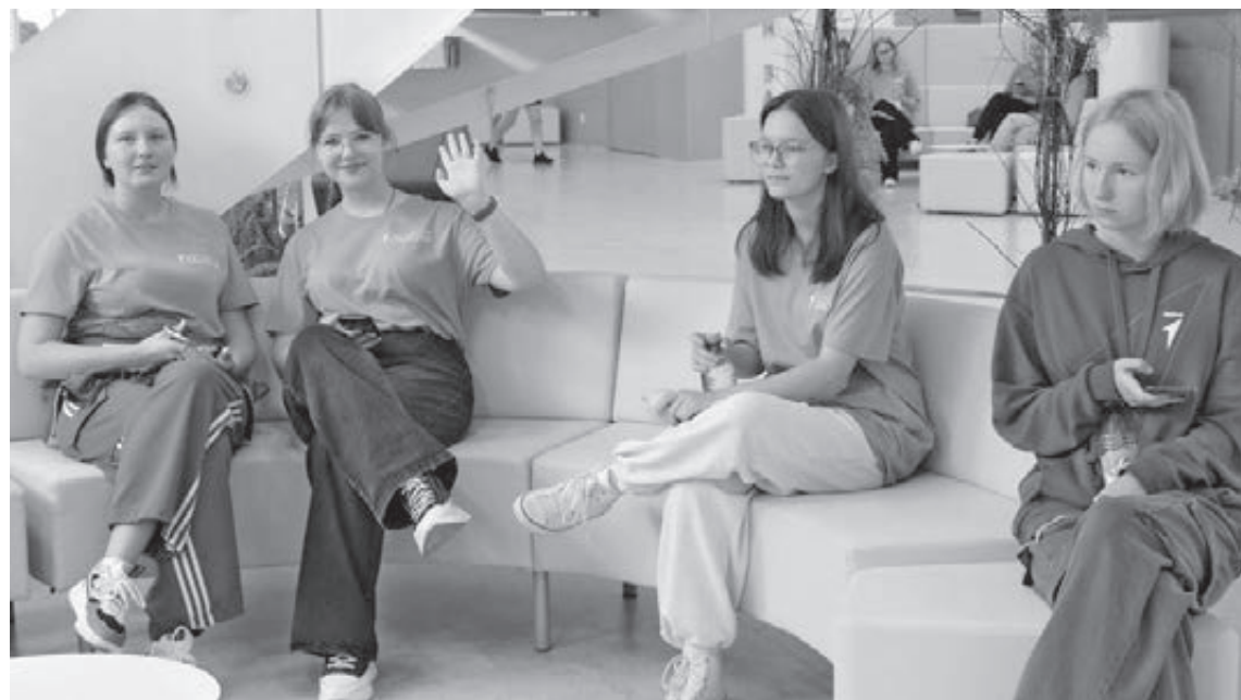
■ Фото Анастасии Белоусовой.

спектакля», «Театроведение», «Продюсерство», «Режиссура кино и телевидения». В этом году появилось и два новых направления. Первое – это «Кинооператорство», специализация – «Телеоператор». Задача специалиста данного профиля – с помощью своих инструментов перевести режиссёрские замыслы в экранный образ. А ещё это профессия, которая совмещает в себе гигантский объём технических знаний и творческих устремлений.