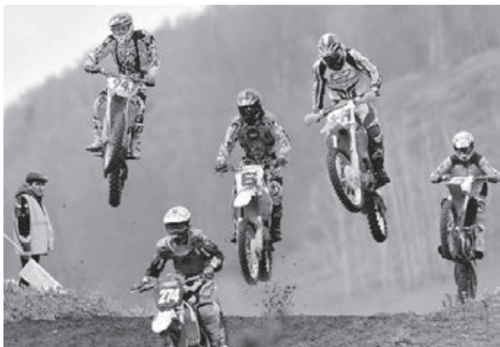
■ Мотокросс – один из самых зрелищных технических видов спорта.