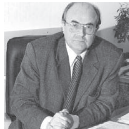
■ Б.П. Невзоров.

Поздравляем юбиляра. Пусть каждый новый день приносит радость, здоровье и душевное спокойствие. Желаем