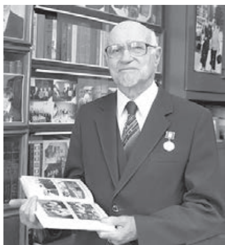
■ Фото Сергея Гавриленко (из архива газеты «Кузбасс»).

У него, обладателя красного диплома, была возможность выбрать место работы