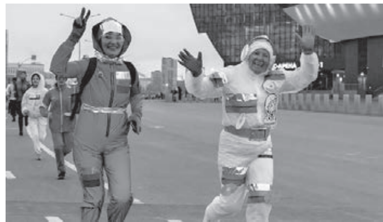
Костюмированный забег «Первый в космосе» стал одним из ярких событий фестиваля Юрия Гагарина.

Чемпионами становятся единицы, профессиональными спортсменами – сотни. Любителей бега, конечно же, намного больше. И в последнее время они всё чаще заявляют о себе массовыми забегами. Некоторые из них, вроде «Зелёного марафона» или «Цепной реакции», проводятся коммерческими предприятиями в благотворительных целях, а также для привлечения внимания к собственным брендам. Другие же органично вписываются в программы тех или иных мероприятий. Яркий тому пример, причём как в прямом, так и переносном смысле, – массовый забег «Первый в космосе», который состоялся в областном центре в апреле этого года в рамках Международного фестиваля Юрия Гагарина. Напомним: 500 человек, в числе которых были спортсмены-любители, школьники и студенты, а также семьи с детьми, преодолели дистанцию в 2 024 метра по дублёру Притомского проспекта и Олимпийскому парку. Участвовали любители бега от мала до велика: