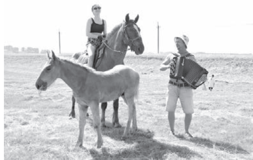
■ Яркие моменты соревнований.

Конноспортивные соревнования памяти Льва Константиновича Варсобина и Сергея Витальевича Лештаева прошли на ипподроме в деревне Кабаново Крапивинского муниципального округа.