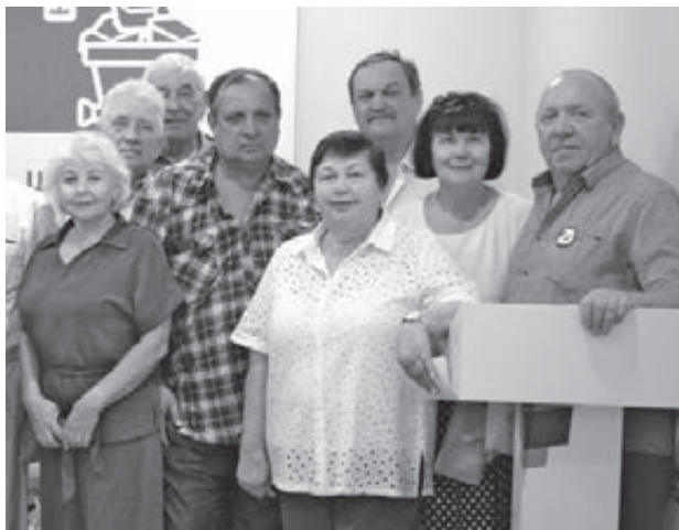
■ Фото Анастасии Белоусовой.

«Всем вам огромное спасибо. Люди чем могут помогают – поддерживают СВО, выделяют средства из семейного бюджета, пенсии. Это не только денежная помощь, в этой помощи – частичка души каждого ветерана. Это дорогого стоит!» – поблагодарила активистов председатель организации Н. П. Неворотова.