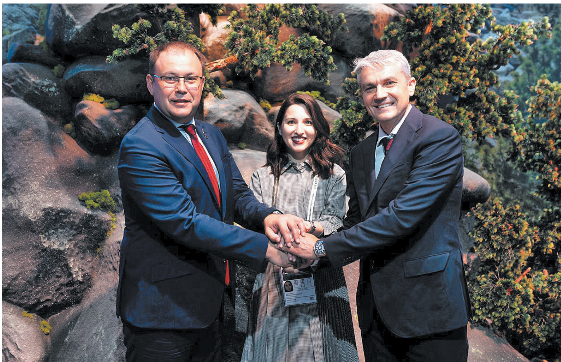
■ Новые соглашения и партнерства помогут развивать туризм в Кузбассе.