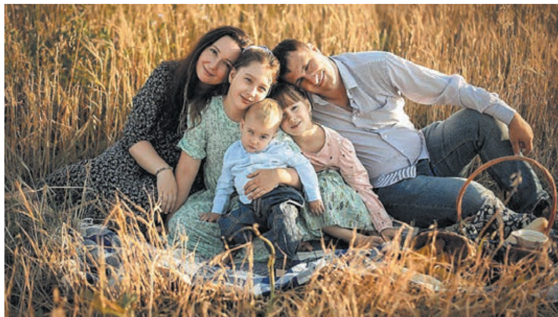
■ Фото Юлии Силиной.