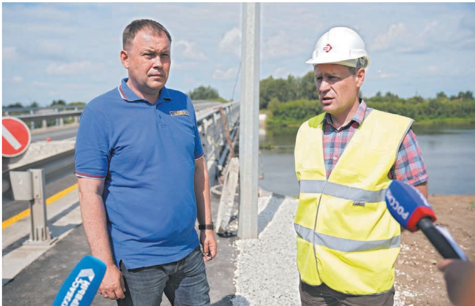
■ Фото Савелия Баширова.