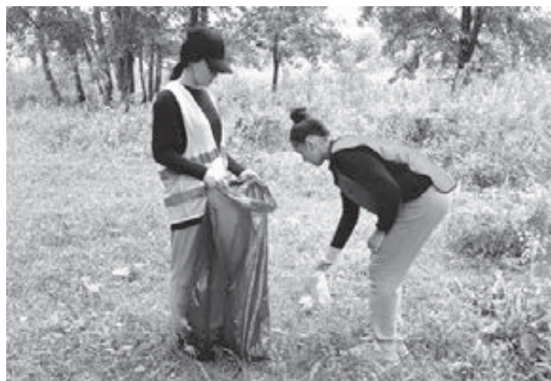
■ Фото пресс-службы АПК.