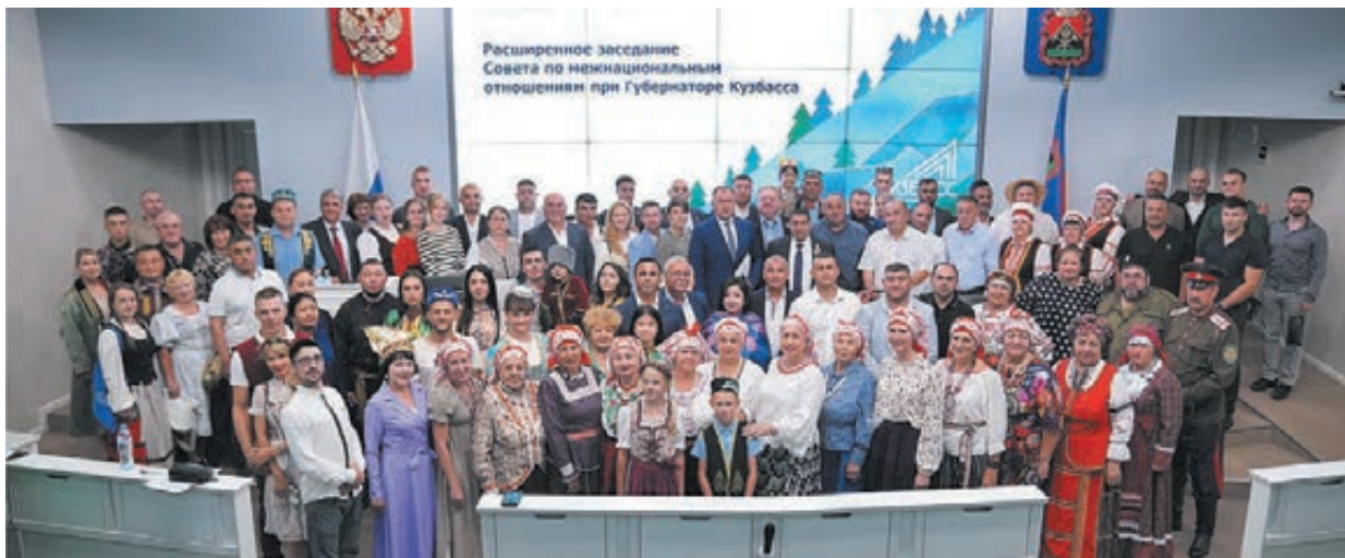
■ Фото пресс-службы администрации правительства Кузбасса.

Врио губернатора Кузбасса Илья Середюк провёл расширенное заседание Совета по межнациональным отношениям.