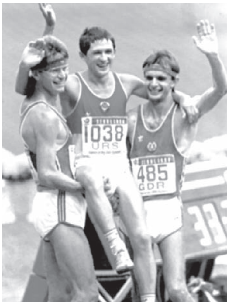
■ Олимпиада-1988. После финиша в спортивной ходьбе на 50 км. Олимпийский чемпион Вячеслав Иваненко, серебряный и бронзовый призёры Рональд Вайгель и Хартвиг Гаудер (оба – ГДР).