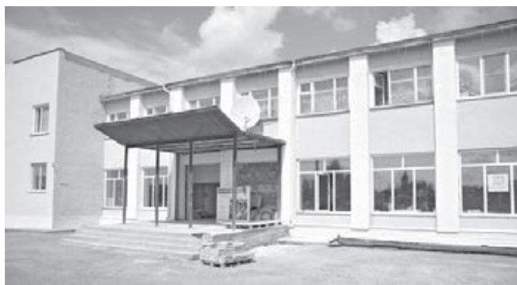
■ Ремонт районного Дома культуры.

Также глава региона подчеркнул, что застройщики должны