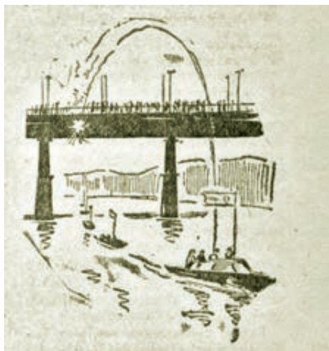
■ На Томи. Рис. М. Панькова.

День, как по заказу, – жарко и лёгкий ветерок. С самого утра на реке чувствовались приготовления к празднованию Дня Военно-Морского Флота. Досаафовцы тренировались на скутерах, моторных лодках, водных лыжах.