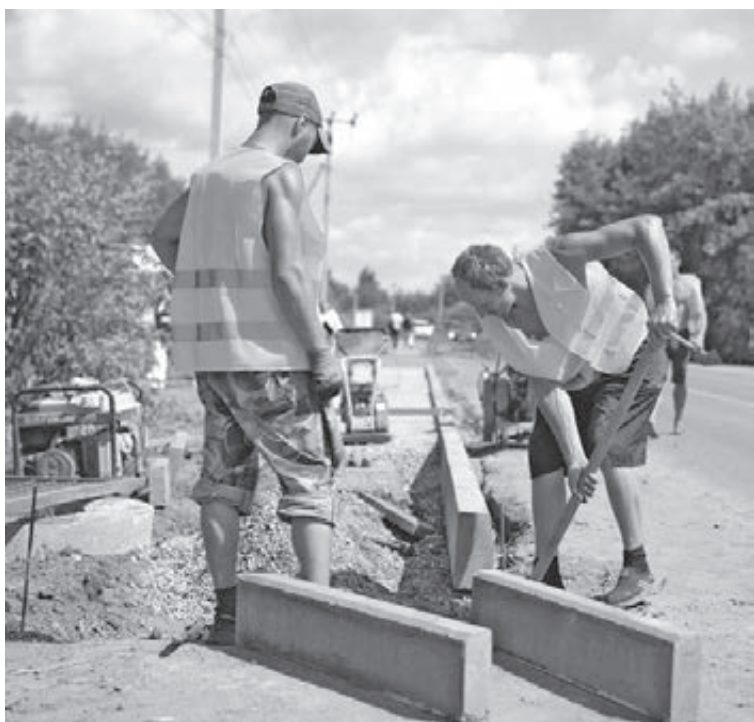
■ Укладка двухкилометрового тротуара.