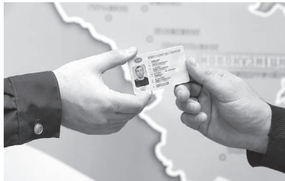
■ Фото ГИБДД Кузбасса.

Сотрудники Госавтоинспекции Кузбасса призывают начинающих водителей к соблюдению всех требований правил дорожного движения, отказу от опасных манёвров на проезжей части и принятию дополнительных мер предосторожности при управлении транспортом.