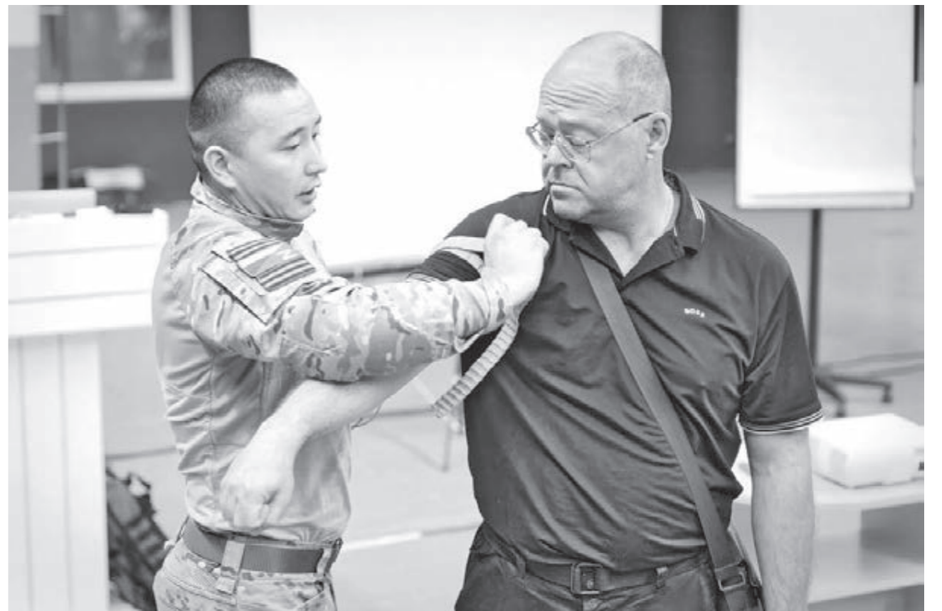
ЖИЗНЕННО ВАЖНЫЕ ЗНАНИЯ. В Кузбассе прошёл массовый мастер-класс по оказанию первой помощи. В нём приняло участие более 200 жителей региона, это работники промышленных предприятий, преподаватели школ, колледжей и вузов, студенты и школьники, волонтеры, военные и люди с ограниченными возможностями здоровья. Обучение проводилось в рамках федерального проекта «Здоровое будущее».