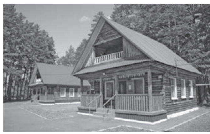
Детский лагерь «Сосновый бор».

«Юргинская городская больница – один из ключевых объектов в городе. Когда строители начали вскрывать конструкции здания, выявилось 700 элементов, которые нужно усилить. Это увеличивает трудоёмкость процесса, но у нас опытные строители, проектировщики, которые выдали необходимые технические решения. До начала отопительного сезона закончатся работы по устройству кровли, фасада и отопления, чтобы закрыть тепловую контур и спокойно работать в три-четыре этажа.