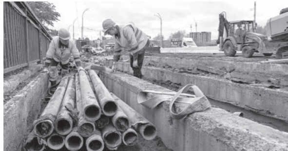
Работы на Кузбасском мосту.