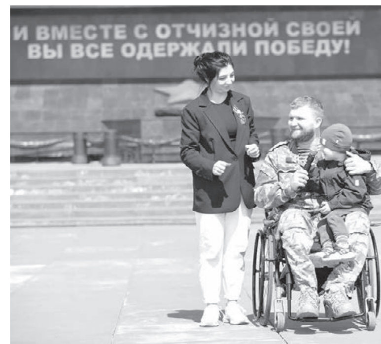
И ВМЕСТЕ С ОТЧИЗНОЙ СВОЕЙ ВЫ ВСЕ ОДЕРЖАЛИ ПОБЕДУ!

1 июня стартовал новый проект фонда — «Наша семья — наша победа!». Каждый филиал проводит серию мероприятий, приуроченных к Году семьи. Проект направлен на сохранение семейного микроклимата.