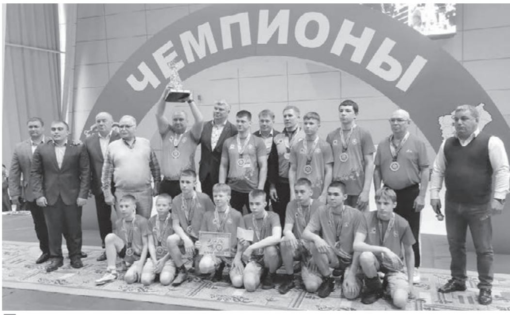
Команда Междуреченска – победитель четвёртого сезона Лиги борьбы Кузбасса.

В матче за третье место команда из Осинников выиграла у хозяев ковра – 7:3. В финальном поединке юношеская сборная Междуреченска уверенно взяла верх над беловскими сверстни-