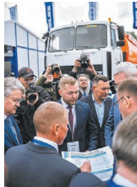
■ Фото Марии Вербицкой.

Специализированный комплекс расположен в центре Кузбасса, вдоль главной магистрали области, соединяющей важнейшие транспортные узлы региона, и создаёт удобную транспортную логистику потребителям техники и услуг. Центр технической поддержки «БЕЛАЗ»