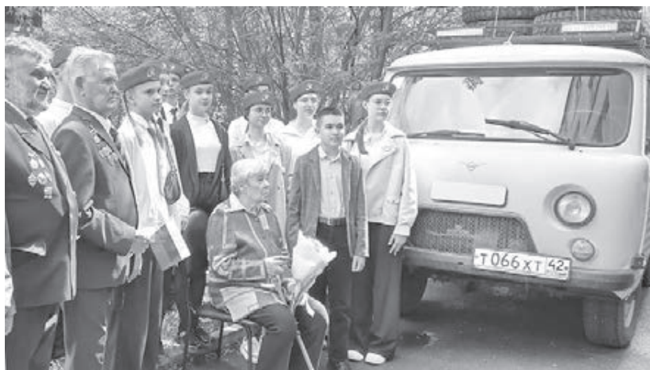
■ Отправка «буханки» участникам СВО.

Прибывшие с СВО земляки вызвались перегнать машину. Впереди долгая дорога: более четырёх тысяч километров до места