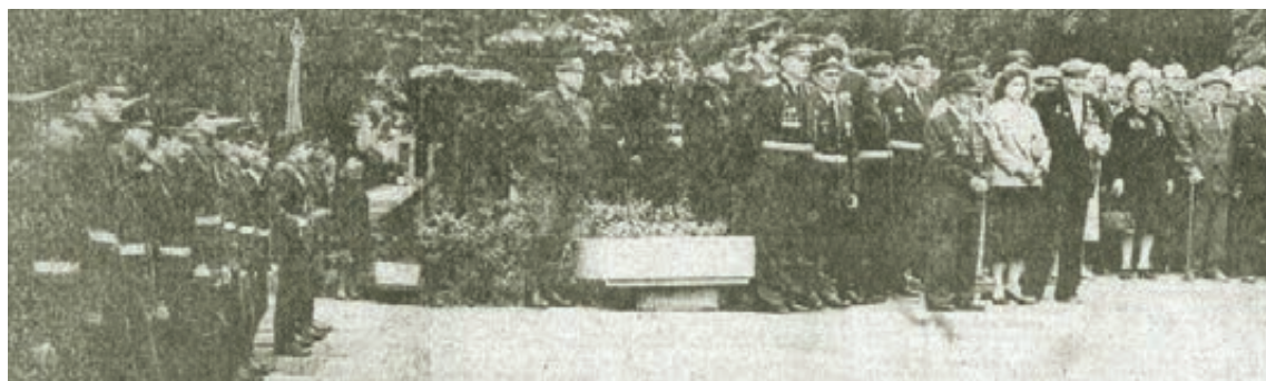
■ Фото из номера за 25 июня 1991 года.