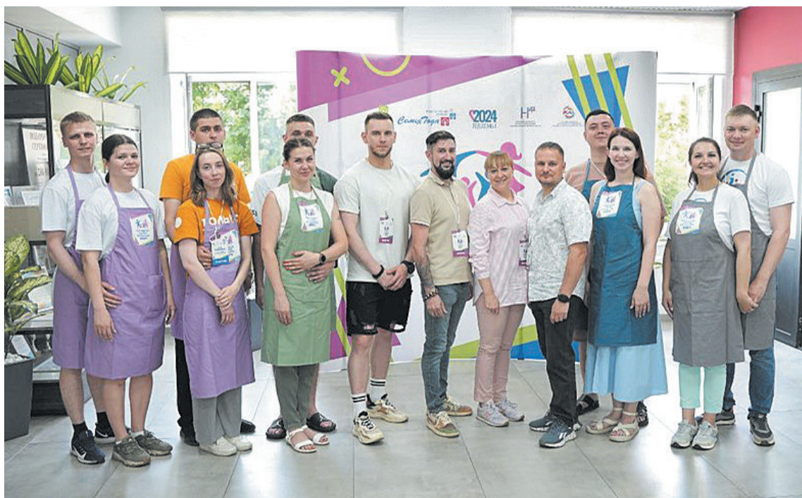
■ В финал конкурса прошли пять молодых пар.