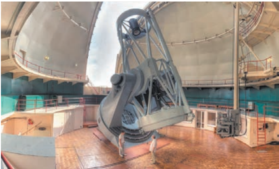
■ ЗТШ – крупнейший телескоп Крымской обсерватории. Диаметр его зеркала составляет 2,6 м. На нём в августе 2007 года была обнаружена новая малая планета, которая сейчас носит имя Юрга.