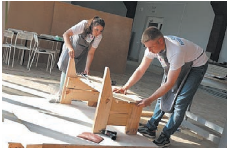
■ Смастерить скамейку оказалось непросто, но все участники справились и с этим испытанием.

Заключительный день наполнился творчеством. Семьи представили визитки, где с песнями, танцами, инсценировками рассказали о себе и своих традициях. Во втором творческом конкурсе участники показывали собственную версию сказок Александра Сергеевича Пушкина, посвящая выступление 225-летию со дня его рождения. Здесь снова каждая пара проявила танцевальные, вокальные, театральные таланты. Причём на сцену выходили не только сами участники, но и их близкие. А в зале каждого артиста горячо поддерживали кричалками, девизами и плакатами болельщики. И группы поддержки реагировали бурно, потому что семьи удивляли. Так, новокузнецкие вывели на сцену все поколения своей большой и дружной семьи, которые мастерски читали стихи. Представители Гурьевского муниципального округа раскрыли секреты долголетья брака старшего поколения. А семья Кемеровского муниципального округа исполняла мечты друг друга прямо на глазах у зрителей: в конце творческого номера папа вынес на сцену настоящего щенка – теперь у них появилась долгожданная для детей собака. Все участники были настолько искренними, что не могли сдержать слёз и радости из-за того, что все они показали силу своих семей, преодолели каждое испытание вместе.