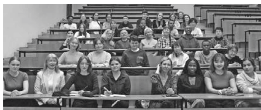
Подготовительные курсы к Тотальному диктанту проходят в КемГУ по пятницам и с участием иностранных граждан. Начало – в 18:00.