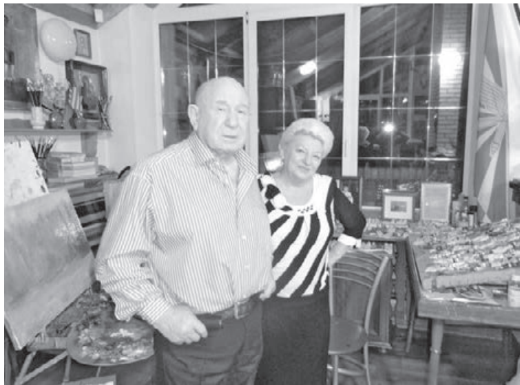
В художественной мастерской в доме А. А. Леонова в с. Леониха. 2012 год.