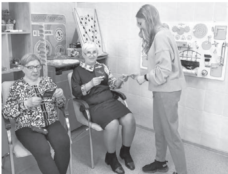
Обучение финансовой культуре охватывает все слои населения Кузбасса.

«Такие просветительские беседы являются важной составляющей работы правоохранительных органов в борьбе с мошенничеством. Они позволяют эффективно обучать на-