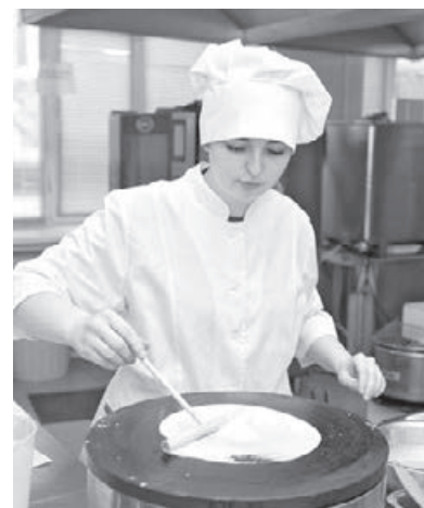
■ Фото Министерства образования Кузбасса.