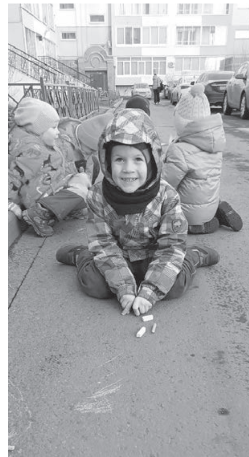
■ Весна – время для активных прогулок, но клещи уже проснулись.

Помните: только вакцинация надёжно защищает от летальных форм энцефалита. Увы, других лекарств, столь же эффективных, нет. Вакцинация проводится в рамках ОМС в поликлиниках по месту жительства. Но детям по ОМС – вакцина только с трёх лет. Частные медицинские центры вакцинируют с года. Различия вакцин в государственных и частных клиниках невелико, они все отечественные. Все создают отличную защиту. Единственное, что на вакцину клещевого энцефалита сухую, которая обычно предоставляется по ОМС, чаще у детей и взрослых может быть реакция в виде высокой температуры. Но это облегчается рядовыми жаропонижающими. Будьте здоровы!