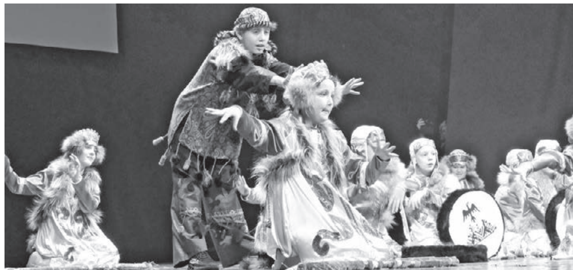
■ Инклюзивные коллективы в этом году приехали не только из сибирских регионов, но и из других уголков нашей страны.