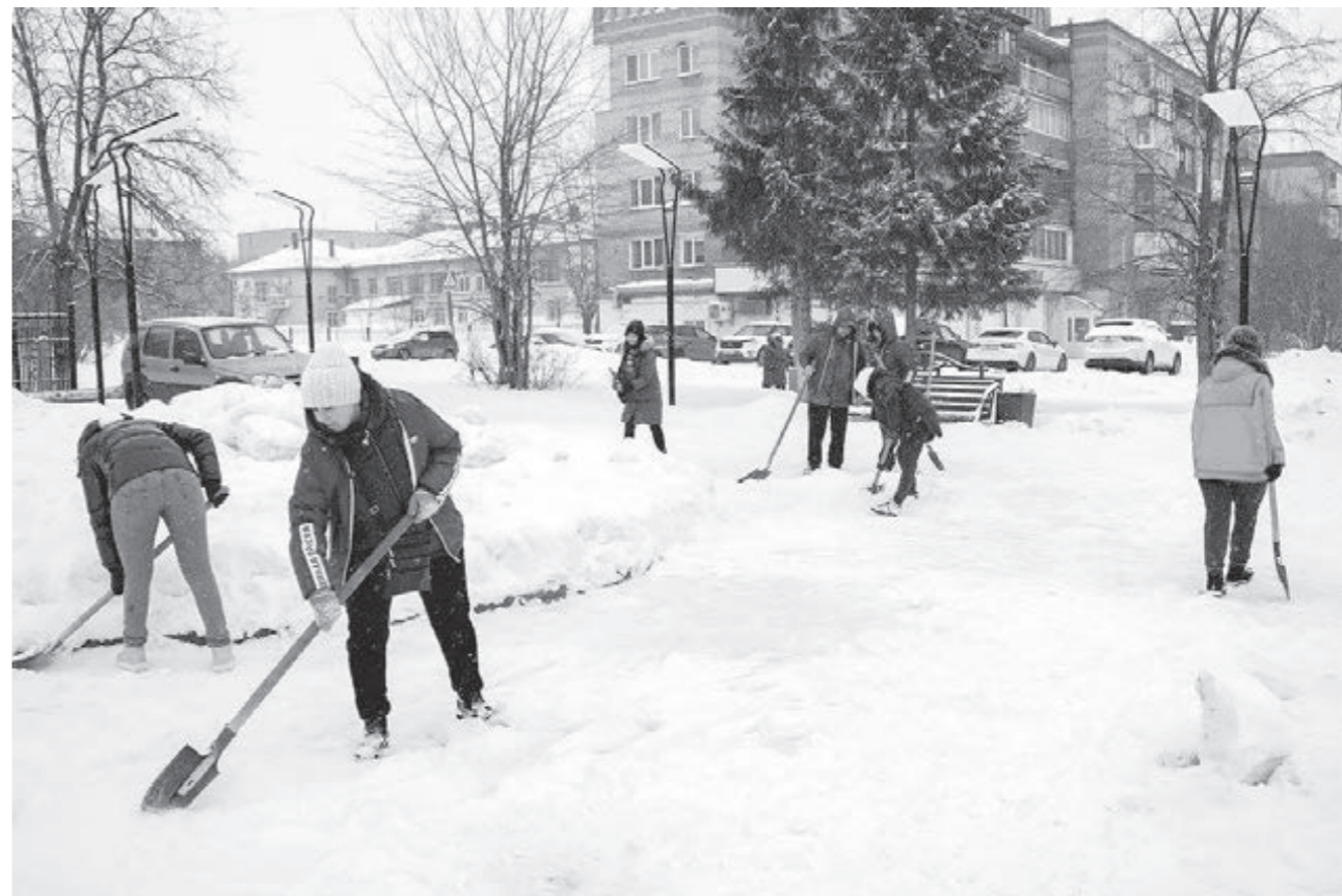
ДРУЖНО И ПОД МУЗЫКУ. Активисты жилого района Кедровка отметили приход весны субботником в сквере у школы № 52. Жители района любят сквер, который в прошлом году благоустроили по нацпроекту «Жильё и городская среда», инициированному президентом России Владимиром Путиным. Поэтому с наступлением первых тёплых дней решили привести его в порядок и пробудить от зимней спячки. Активисты дружно и под музыку расчистили пешеходные дорожки от снега и завершили мероприятие приятной беседой за ароматным чаем с выпечкой.