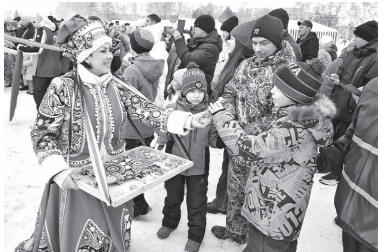
МАСЛЕНИЦА ПРИШЛА. С этого понедельника началась масленичная неделя, которая завершится Прощёным воскресеньем. В эти дни принято устраивать народные гуляния с угощениями, играми, сжиганием чучела Масленицы. Ранее их называли проводами зимы. В некоторых территориях такие праздники прошли в прошедшие выходные. Так, праздник «Проводы русской зимы» состоялся в разных районах Промышевска. Масленичная неделя предвещает Великий пост у православных. Он начнётся 18 марта. Пасху в этом году отмечаем 5 мая.