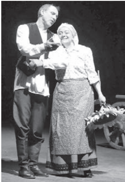
Кадр из спектакля «Поминальная молитва».

29 февраля – фантастическая драма «Созвездия» по одноимённой пьесе Ника Пейна. Отношения героев спектакля Роланда и Марианны словно развиваются в нескольких параллельных вселенных. Каждый ключевой этап отношений они переживают во множестве вариаций. Им предстоит пройти через вероятные