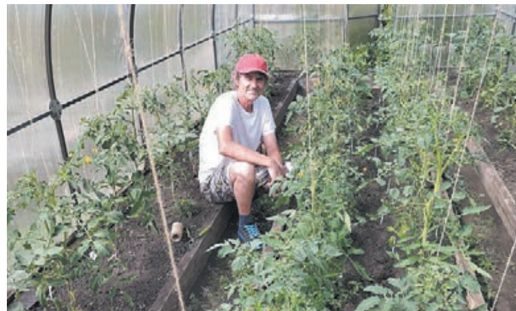
■ Фото из личного архива Сергея Макарова.

Уверенно чувствует себя в золотой десятке и коллекционный итальянский сорт «рабочий выпуск пасты». «Сочные мясистые томаты отлично подходят для салатов, приготовления соу-