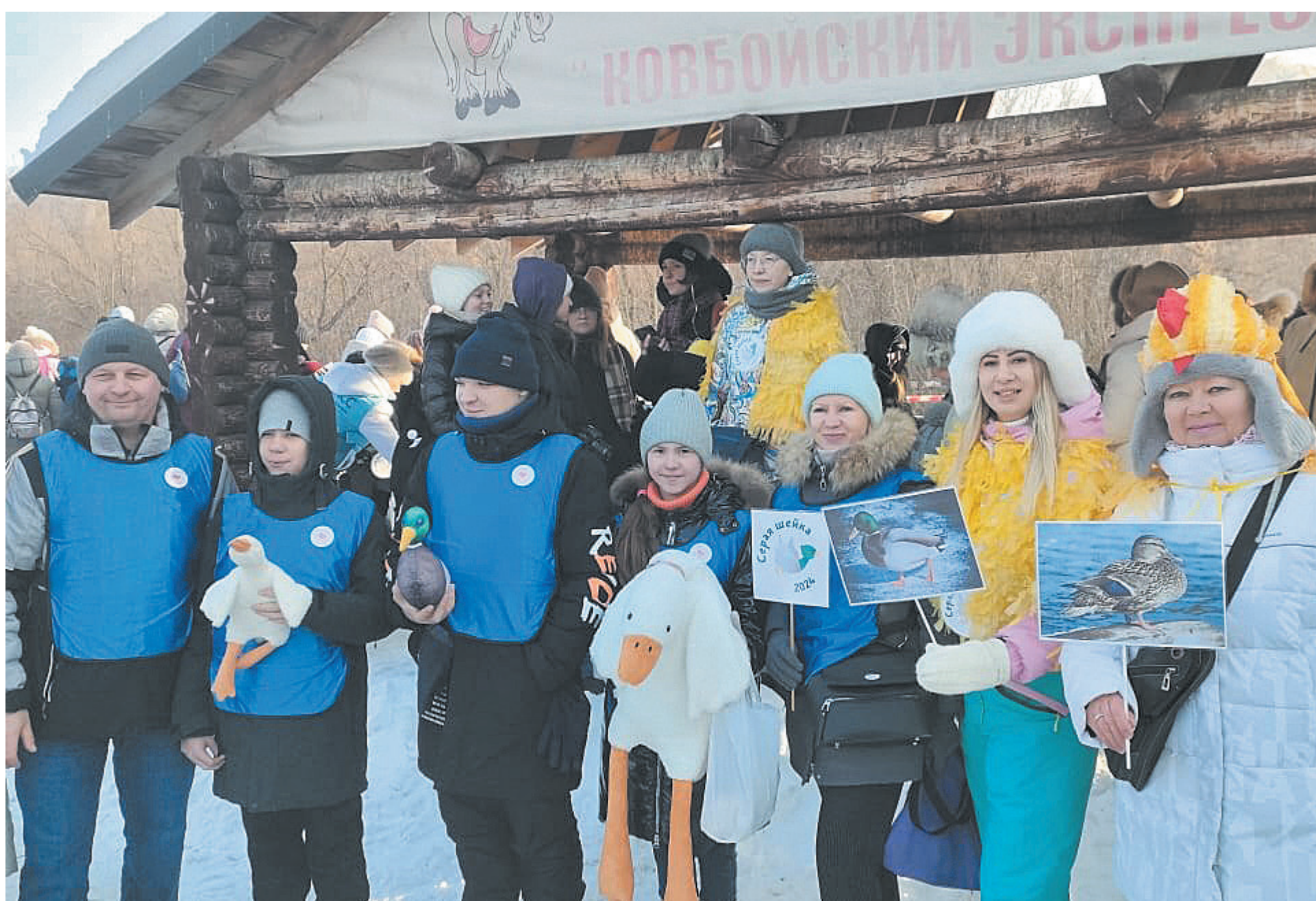
■ Фото предоставлено Дворцом творчества детей и молодёжи.