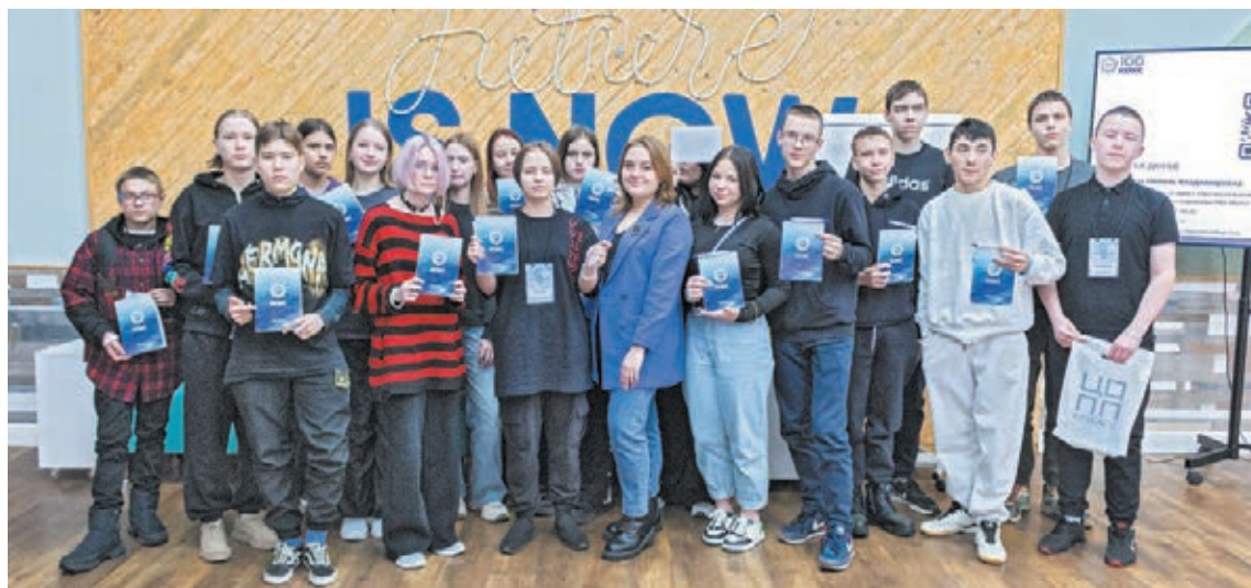
■ Правильный выбор профессии – залог успешного завтра.

ЦОПП и завод заключили соглашение для объединения совместных усилий по опережающей профподготовке кадров. Команда центра подготовки выявляет наиболее востребованные в регионе профессии, информирует работодателей о