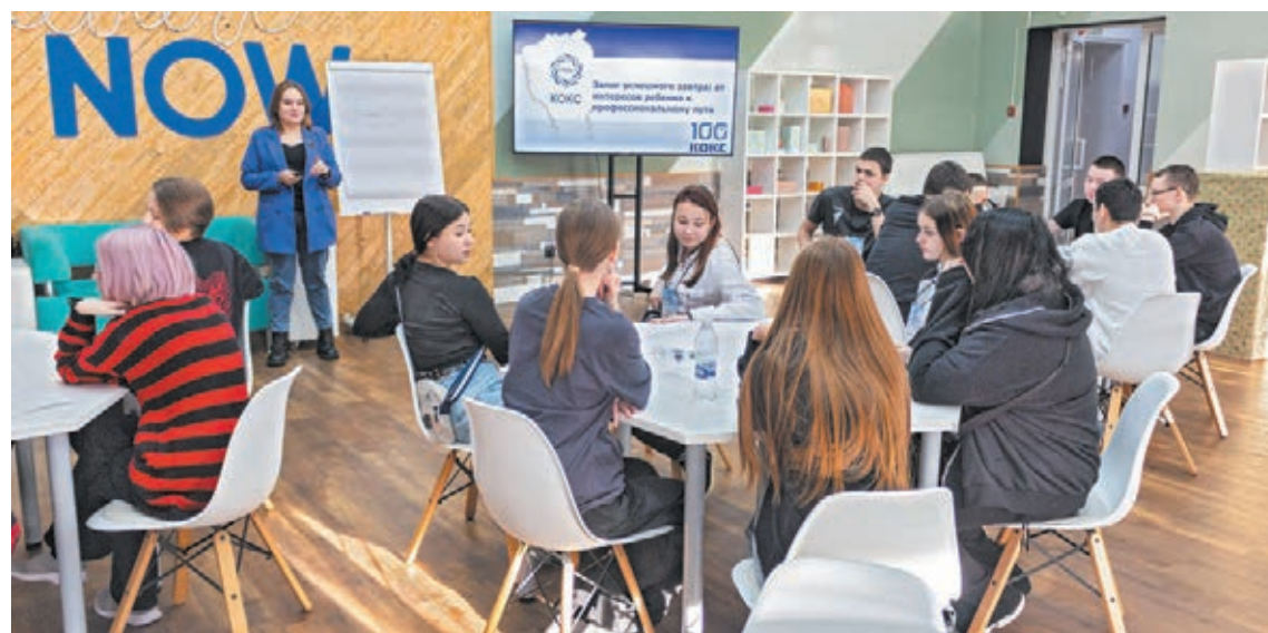
■ Школьникам рассказывают о востребованных профессиях на предприятии.