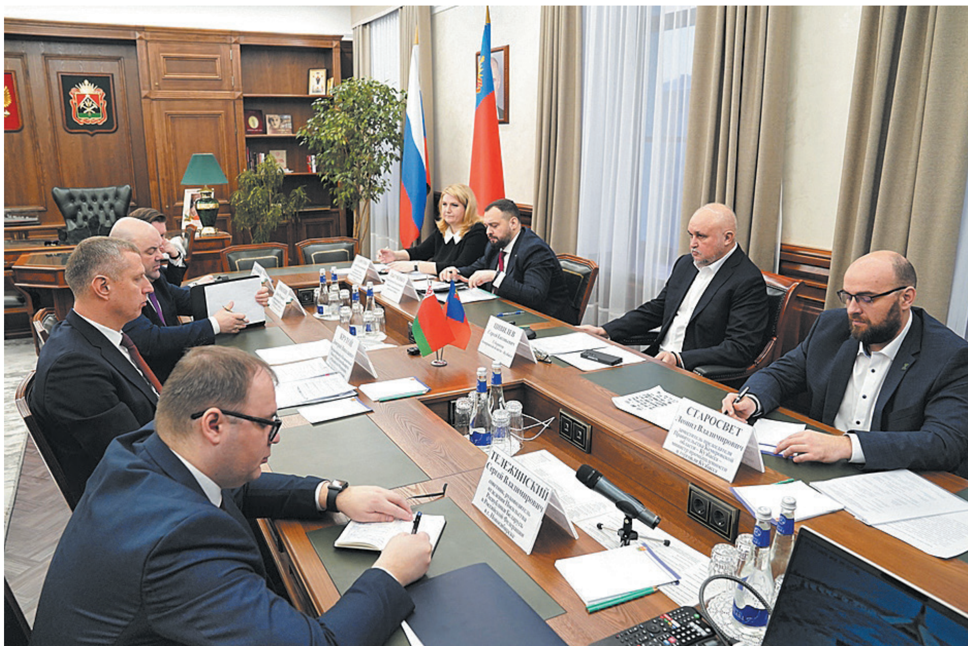
■ Фото Константина Полюцкого.