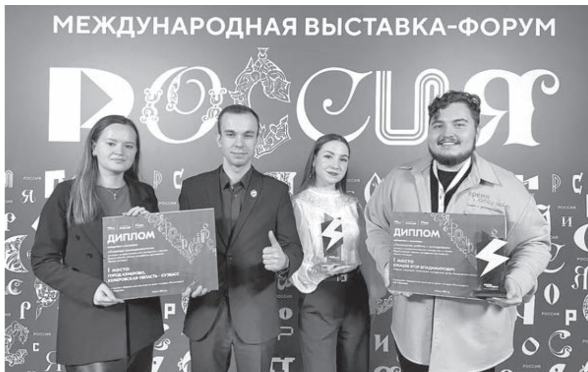
■ Фото с сайта Администрации Правительства Кузбасса.