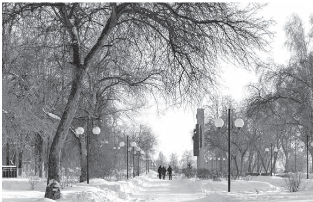
■ Набережная Кировского района – один из объектов, кардинально преобразившихся по нацпроекту «Жилье и городская среда».

По данным Росстата, миграционная убыль населения в Кузбассе сократилась почти в два раза. Всё больше жителей региона предпочитают остаться на малой родине и внести вклад в её дальнейшее развитие. Причина тому – создание комфортных условий для жизни, которым в последние годы уделяется повышенное внимание.