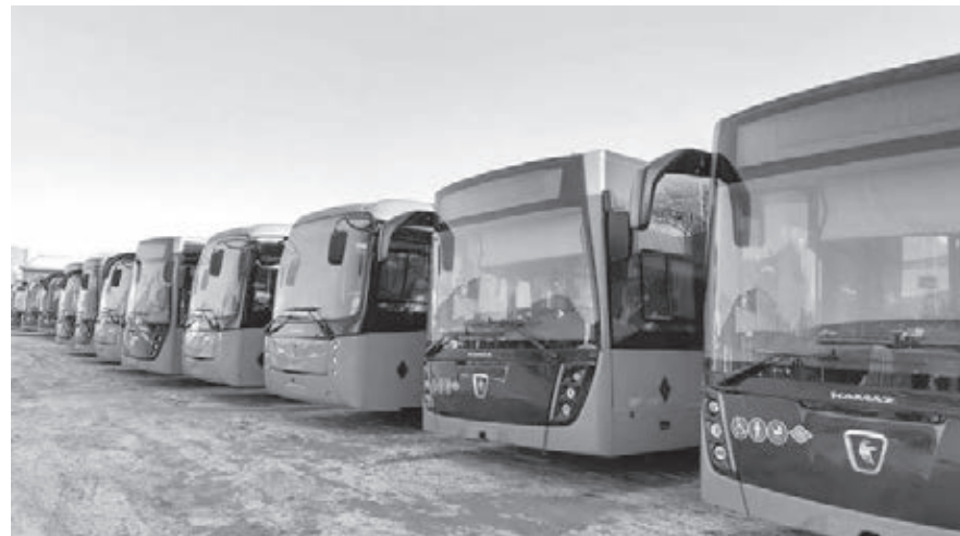
■ Фото пресс-службы АПК.

Междугородные и пригородные автобусы оснащены системами климат-контроля, регулирования уровня пола,