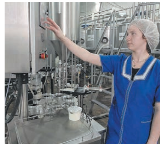
■ Фото пресс-службы АПК.