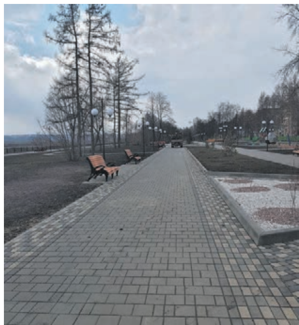
■ Фото пресс-службы АПК.

В 2024 году в Кузбассе в рамках нацпроекта планируется благоустроить 170 объектов. Объём финансирования составит свыше 1,6 млрд рублей.