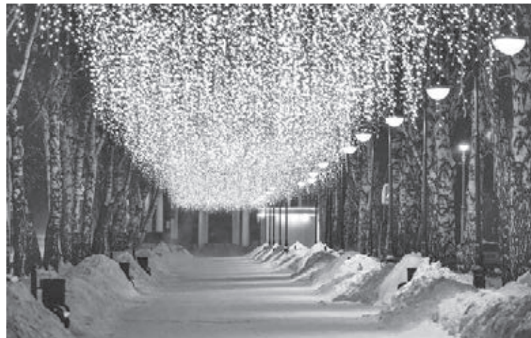
■ Пешеходная аллея на улице Кирова – один из объектов, преобразившийся благодаря активности кемеровчан.

К слову, об упомянутых выше мостах в центре города. В этом году заработает на полную мощность молодёжное арт-пространство под Красноармейским мостом, которое начали обустроить в минувшем декабре. Здесь будут проходить открытые кинопоказы и небольшие уличные фестивали. Что же касается Университетского моста, то благодаря ремонту шандоров впервые за долгие годы появится возможность поднять