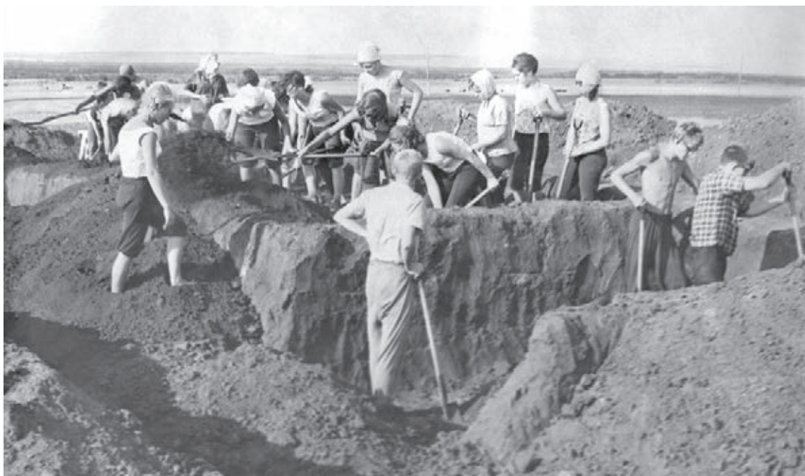
■ Краеведы в научной экспедиции.