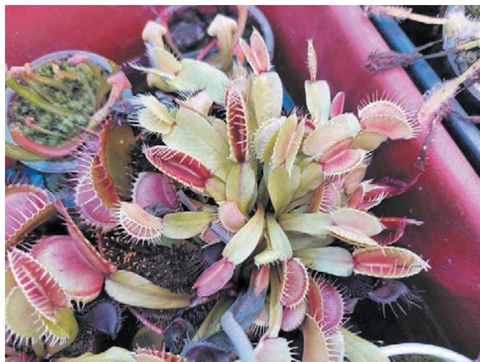
■ Венерина мухоловка.

уже посеяли, а чтобы они хорошо взойшли, нужна стратификация – условия пониженной температуры на протяжении нескольких месяцев (желательно около нуля градусов). «Горшки поставили к окну, – подчеркнула собеседница. – Важно уточнить, что семена всхожи только свежими. Если они какое-то время полежат, к примеру, год, то из них уже ничего не вырастет».