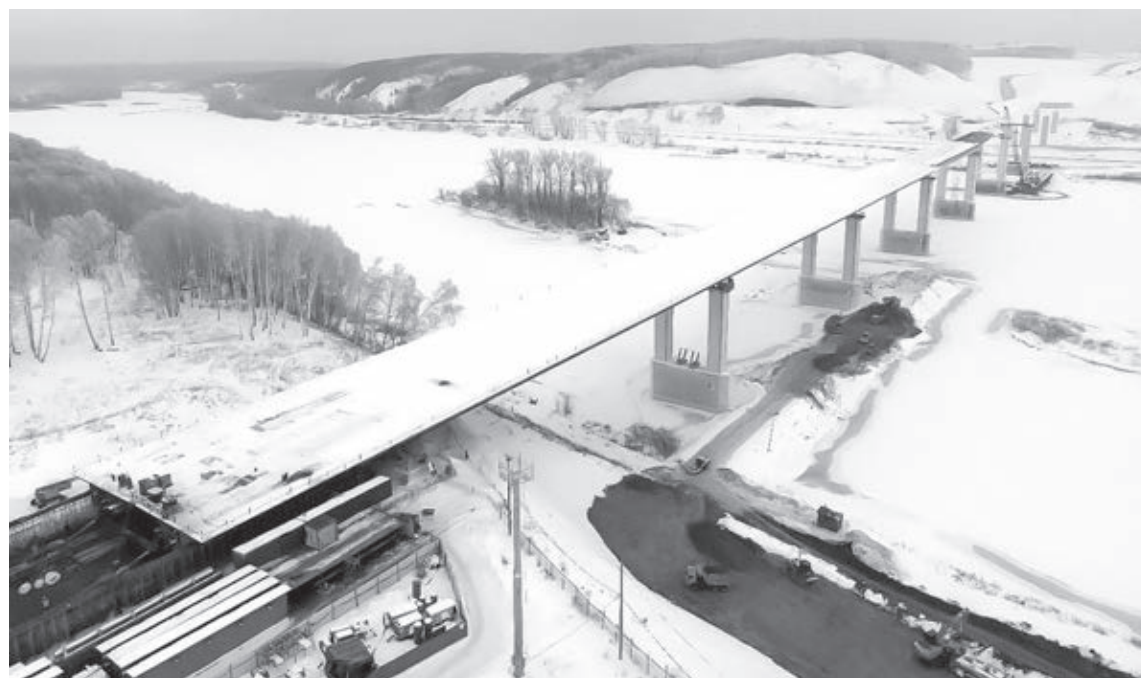
■ Северо-Западный обход Кемерово важен для развития экономики Кузбасса и транзитного транспорта всей страны.

«Важно, что именно жители региона принимают в этой работе активное участие и в ходе онлайн-голосования сами выбирают территории для благоустройства. За пять лет участия в нацпроекте Кузбасс преобразился, стал более современным, удобным, с красивыми и уютными общественными пространствами. Причём важна не только эстетика – обновлённые дворы, скверы и площади соответствуют современным требованиям безопасности. В 2024 году эта работа будет продолжена, в планах – отремонтировать 100 дворовых и 70 общественных территорий», – губернатор Кузбасса Сергей Цивилев.