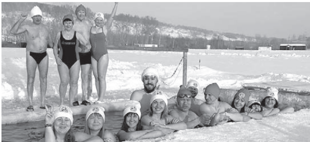
Активисты клуба закаливания и зимнего плавания «Снегири».