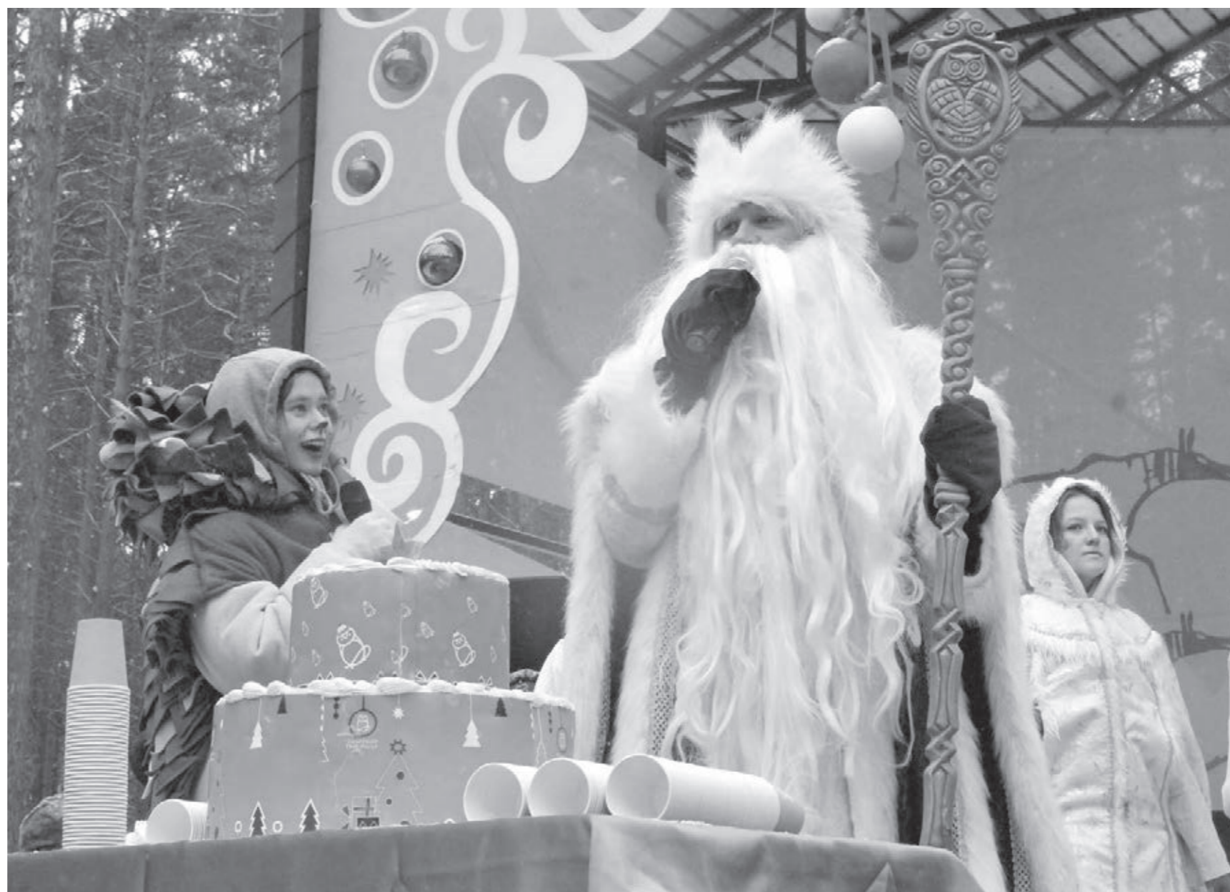
Открытие резиденции Деда Мороза в музее-заповеднике «Томская Писаница».

В Кузбассе стартовала новогодняя кампания