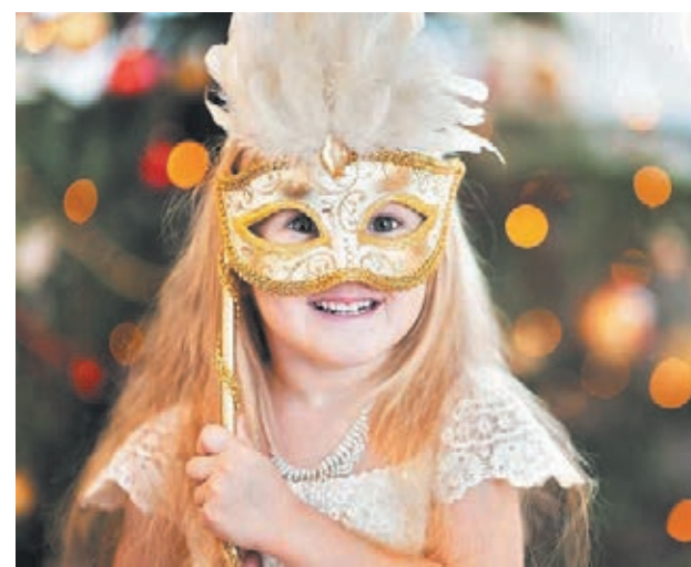
■ В рамках выставки посетители смогут окунуться в атмосферу новогоднего бала.

«Бахрушинский музей продолжает проект «Звёздные страницы балета», который в сентябре стартовал в Калининграде. Первая выставка имела огромный успех, и мы рады показать её теперь в Кемерово. Посетители смогут увидеть эскизы костюмов и декораций, редкие фотографии, видеофильмы, архивные видеозаписи спектаклей и репетиций, а также подлинные театральные костюмы из фондов нашего музея. Мы благодарим губернатора Кузбасса Сергея Цивилёва, всех партнёров проекта за поддержку в организации этой прекрасной выставки, а также команду Кузбасского центра искусств», – отмечает генеральный директор Бахрушинского театрального музея Кристина Трубинова.