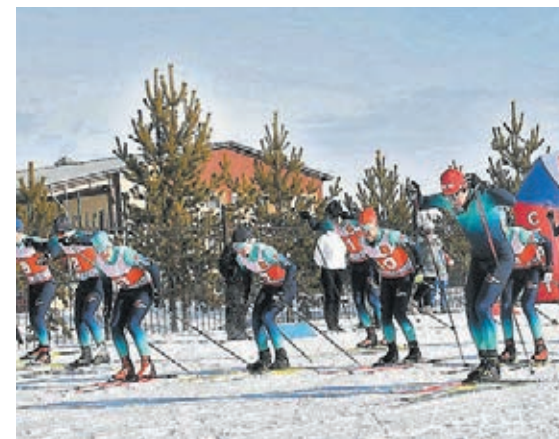
■ Фото с сайта АПК.