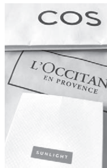
■ Брендовые пакеты часто продаются и покупаются.

А ещё есть вещи-мусор, которые могут быть совершенно разной цены. Например, дорогая шуба, которая висит годами. Мы ей не пользуемся, но помним,