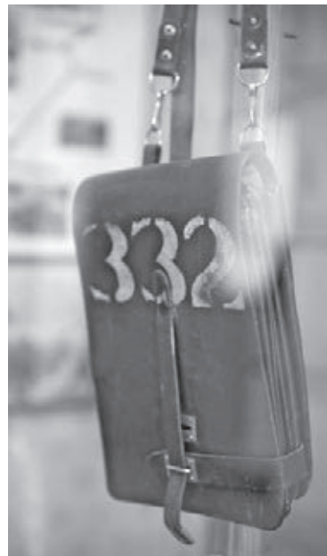
Солдатский планшет Андрея Милыева, один из экспонатов музея.

Учащиеся школы № 69 бережно хранят память об Андрее Милыеве. Ребята подготовили экскурсии по музею, в ходе которых знакомят гостей с биографией героя. Регулярно проходят тематические мероприятия, например урок мужества и урок памяти, посвящённые ему.