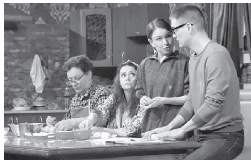
■ Фрагмент спектакля «Простаковы».

Особый подарок приготовил театр на Рождество: 7 января состоится спектакль «Всего-то навсего». Это душевная история о юродивом Иоанне – современном герое, неизменно дарящем окружающим любовь и добро, спасающем словом и делом. Режиссёр спектакля – заслуженный артист РФ Олег Кухарев.