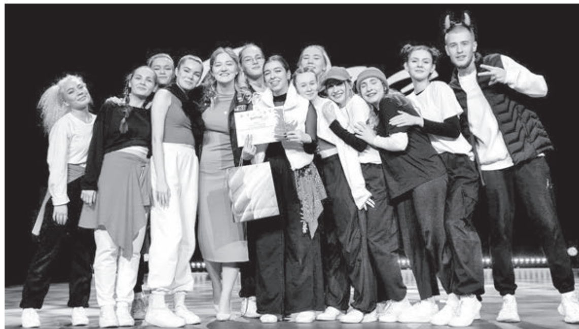
■ Фото организаторов фестиваля «Голос отряда».