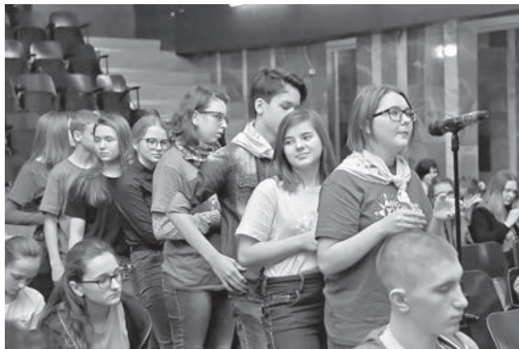
■ Открытый микрофон на заданную тему, 2017 год.

«Всего за одну неделю я получила классный опыт и полезные знания, познакомилась с интересными людьми, испытала