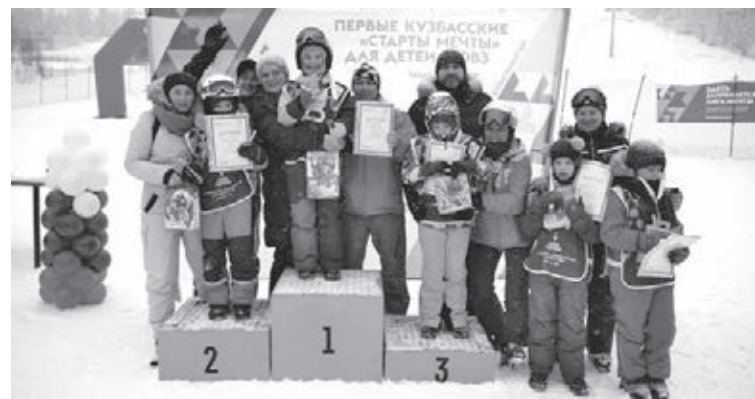
■ «Старты мечты» стали завершающей спортивной встречей в очередном сезоне реабилитационной программы «Лига мечты».

Чтобы принять участие в соревнованиях по скоростному спуску с горы на лыжах, все ребята прошли тренировочный курс с опытными тренерами, которые имеют специальную подготовку по работе с особенными детьми. Среди участников были