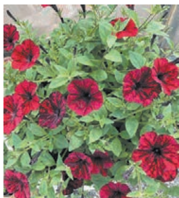
■ Цветы – фирменный знак семейного участка.

Как известно, бархатцы приносят ещё и пользу: отпугивают запахом вредителей. «После того как они отцвели, я их в компост не отправляю. Вырываю кустики и укрываю чеснок, посаженный в зиму. А также растения можно измельчить и заложить в грядку. В почве за зиму они перегниют, и получится отличный грунт