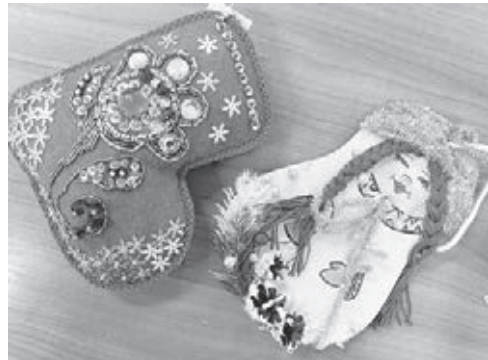
■ Фото предоставлено пресс-службой администрации Кемерово.

Кемеровчане активно готовятся к Новому году, участвуя в конкурсах. Так, более 150 заявок поступило на городской конкурс «Новогодний этностиль». Его организаторы – управленческие культуры, спорта и молодёжной поли-