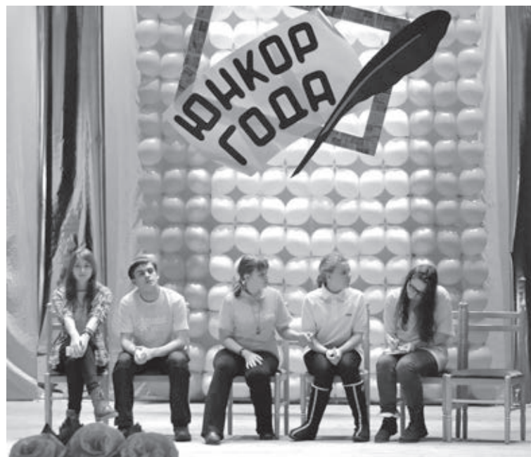
■ Участники конкурса «Юнкор года» выполняют задания, 2013 год.