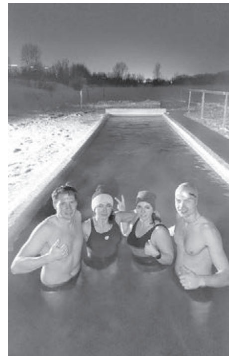
■ Момент суточного марафона.