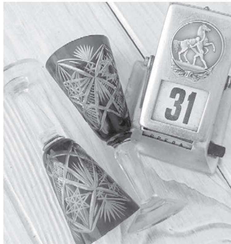
■ Вещи времён СССР всегда в цене, они возвращают нас в детство.

за собственные тёплые воспоминания, а не только за возможности, которые даёт подобная вещь. Далее – электроника, игрушки, посуда, статуэтки, картины. Здорово продаются вещи пакетами. И пусть пакет стоит как одна самая дорогая вещь, зато он точно уйдёт. Берут часто детям (сменную одежду для дачи) и мужчинам, которые едут на вахту (им всегда нужны вещи для работы).