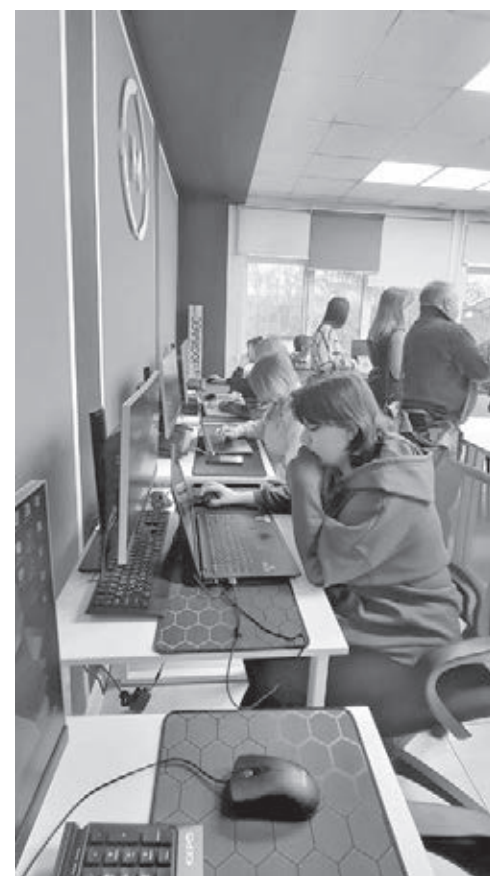
■ Фото Оксаны Сохаревой.