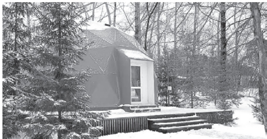
■ Фото пресс-службы администрации Кемерово.