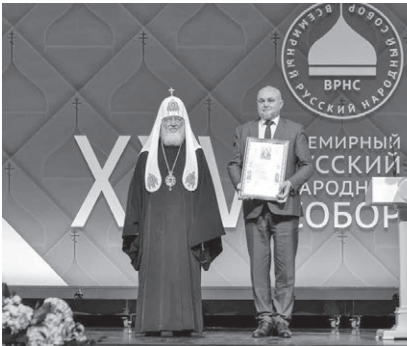
■ Фото с сайта АПК.

Сергей Цивилев напомнил, что в Кузбассе с 17 по 23 ноября проходила Международная научно-практическая конференция «Развитие производительных сил Кузбасса: