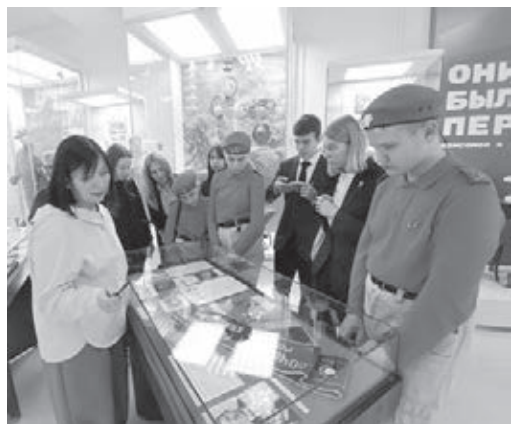
Ребята побывали на выставке «Они были первыми. Комсомол в истории Кузбасса» в отделе истории Кузбасского государственного краеведческого музея.

Все участники встречи посетили выставку «Они были первыми. Комсомол в истории Кузбасса» в отделе истории Кузбасского государственного краеведческого музея. Здесь юнкоры увидели документы из регионального архива, отражающие историю становления комсомола