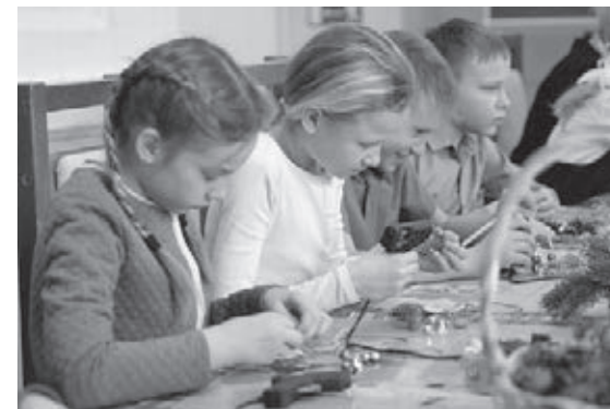
■ Фото пресс-службы администрации Кемерова.