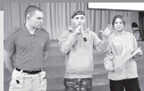
■ Фото Алисы Лукьяновой.

опережающей профессиональной подготовки Кузбасса представители Пограничного управления ФСБ России по восточному арктическому району (Петропавловск-Камчатский) провели военно-патриотическую встречу с обучающимися по программам СПО. Ребята узнали о силовых структурах Российской Федерации, основных направлениях деятельности ФСБ, первоочередных задачах, а также специфике пограничной и береговой охраны. Студенты задавали вопросы о возможностях поступления и актуальных специальностях, условиях несения службы.