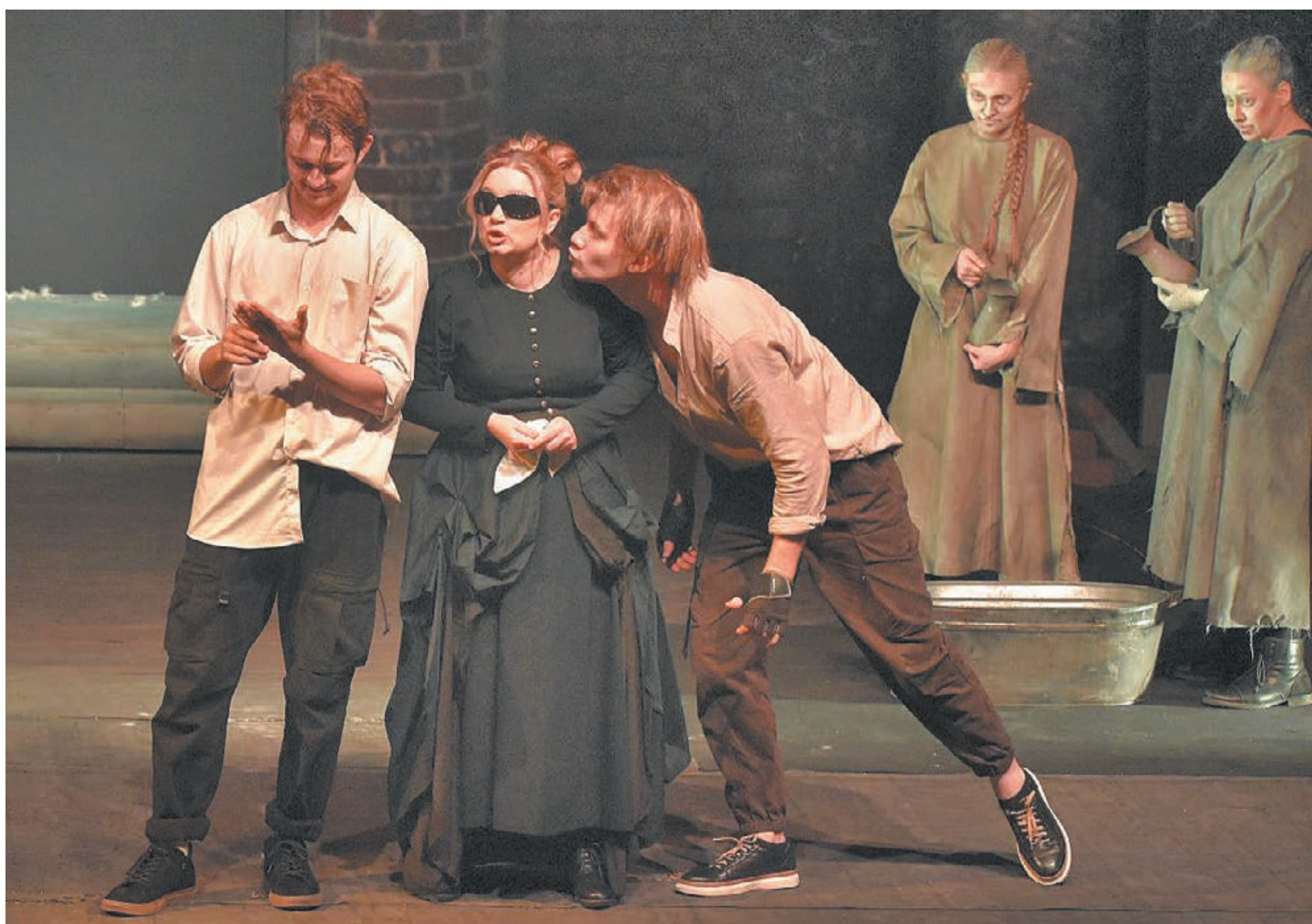
■ Фото Юрия Кузнецова.