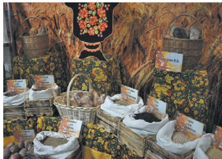
Моменты выставки «АгроКузбасс».

Также в Кузбассе в этом году создан первый кооператив второго уровня, который позволит минимизировать расходы сельхозпроизводителей на закупку расходных материалов, органи-