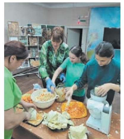
■ Фото из личного архива Натальи Игнатьевой.

В Кемерове воспитанники естественнонаучного центра «Юннат» сделали заготовки на зиму. Это часть важного эксперимента по сортоиспытанию.