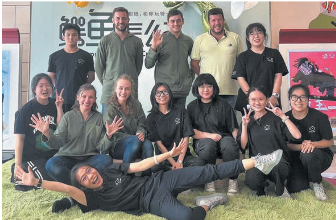
■ Фото предоставлено Театром для детей и молодёжи.