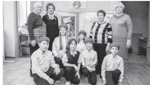
Встреча с волонтерами.

Активисты ветеранской организации, помимо участия в таких конкурсах, проводят работу по патристическому