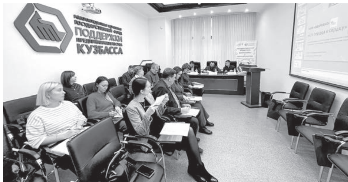
■ Фото Константина Полюцкого.