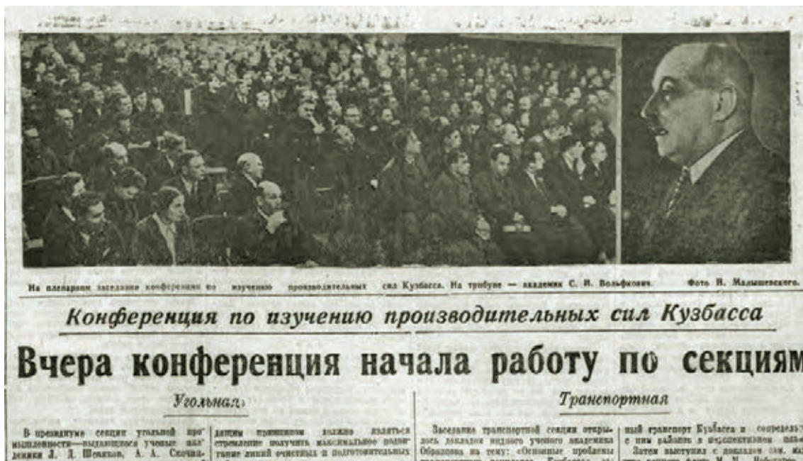
■ Газета «Кузбасс».

КУЗБАССКУЮ КОНФЕРЕНЦИЮ УДАЛОСЬ ПРОВЕСТИ В РЕЗУЛЬТАТЕ АКТИВНОГО ВЛИЯНИЯ ВИЦЕ-ПРЕЗИДЕНТА АКАДЕМИИ НАУК СССР ИВАНА ПАВЛОВИЧА БАРДИНА И ПЕРВОГО СЕКРЕТАРЯ КЕМЕРОВСКОГО ОБКОМА КОМПАРТИИ ЕВГЕНИЯ ФЁДОРОВИЧА КОЛЫШЕВА.