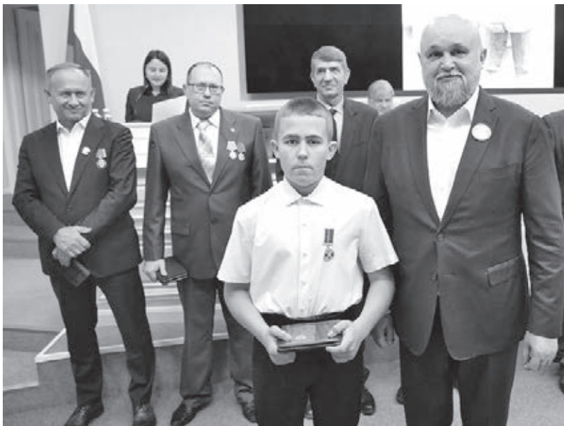
■ Фото пресс-службы АПК.

Как рассказывают в школе, Артём – ответственный и трудолюбивый ученик. Никогда не отказывает в помо-