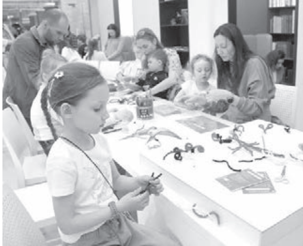
■ Одна из самых популярных локаций – это зона мастер-классов.

Музей-заповедник «Красная Горка» в рамках акции проведёт познавательно-развлекательную программу. Каминный зал станет концертной площадкой. Творческий вечер «Искусство быть» откроет для слушателей кемеровские музыкальные таланты. Другая площадка – музейный кинозал, где будут представлены фильмы о городе и подборка исторической видеохроники. На мансарде музея – в «комнате Рутгерса» – откроется детский кинотеатр с диафильмами. В залах музея будет проходить командная игра «Шахтёрские легенды у камина». Участники «обезвредят» забой от метана и освоят «тимбилдинг» по-шахтёрски. На территории музея состоится «Экскурсия под звёздами» в шахтёрских касках с заж-