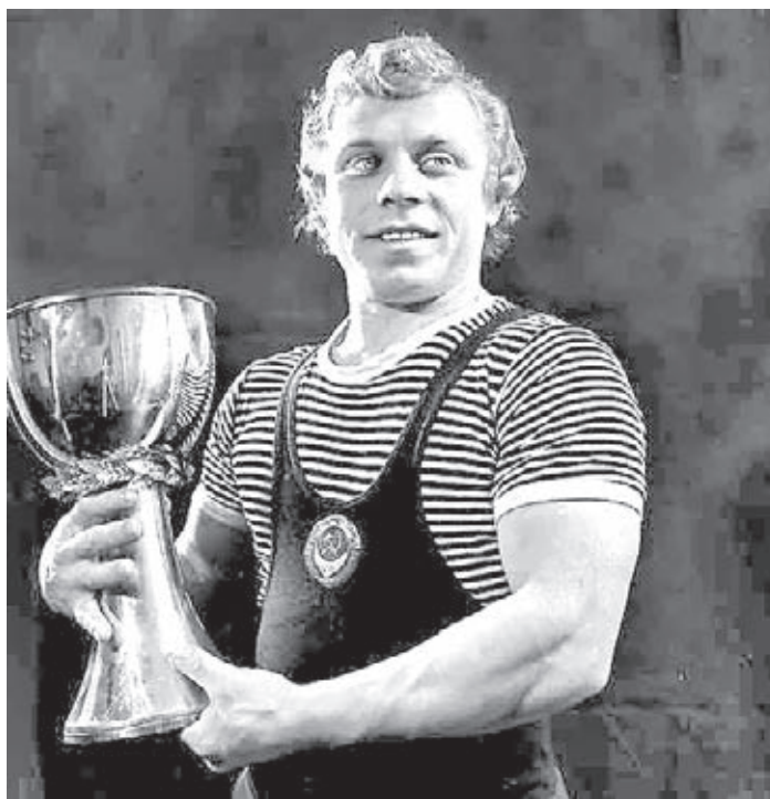
■ Гений «железной игры» Александр Воронин установил 14 мировых и 17 рекордов СССР.

На Олимпиаду-1976 в канадский Монреаль Воронин поехал в ранге вице-чемпиона мира – 1975. В наилегчайшем весе