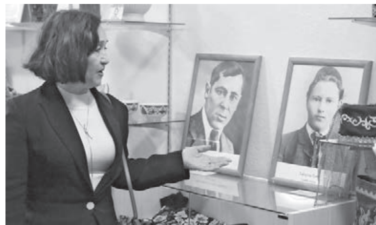
■ Фото Сергея Шпица.

ные татарские предметы быта. Жители передали музею семейные артефакты, фотографии и национальную одежду. У нас даже есть предметы начала XIX века: маслбойка и стиральная доска, прялка. Одна жительница передала удивительный ковёр ручной работы. Музей станет объединяющим центром для жителей села. Это первое подобное учреждение в Кузбассе, полностью посвящённое татарской культуре», – рассказывает Алия Надьмова, заместитель председателя правления региональной общественной организации «Татарская нацио-