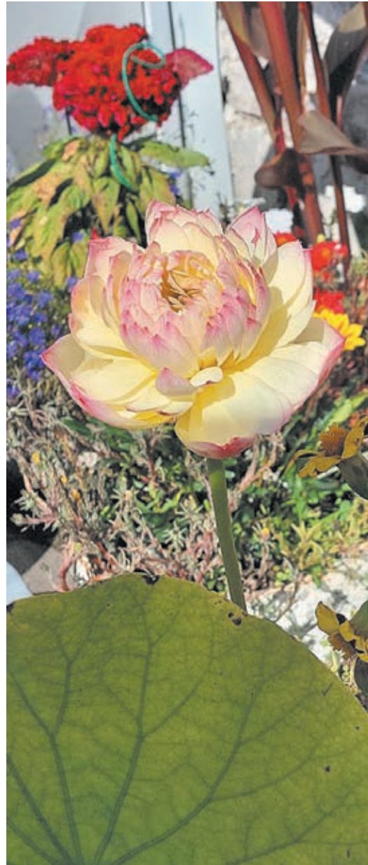
■ Лотос пахнет почти так же, как пион.