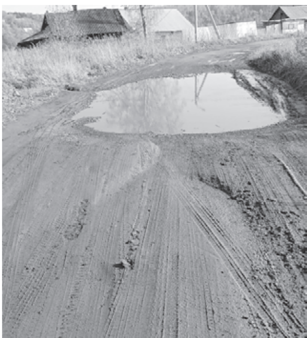
Подготовила Алена СМЕРНОВА.

По словам нашего подписчика, в жилом районе Промышленном на улице Братской ремонт дороги не делали около 12 лет. Фотографии, приложенные к письму, наглядно демонстрируют состояние этого участка, а ведь там оживлённое движение. В непогоду ситуация становится ещё хуже. Ранее местные жители обращались в территориальное управление жилых районов Кедровка, Промышленновский, но вопрос так и остался открытым. Для разъяснения мы подготовили запрос в пресс-службу города Кемерово и вот какой ответ получили накануне: «Плановый ремонт улиц частного сектора в этом году завершён. До конца года будет сформирован список улиц для ремонта в следующем благоустроенном сезоне. Улицу Братскую планируется включить в программу ремонта 2024 года».