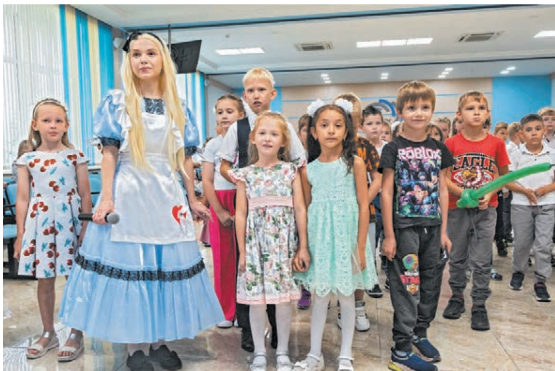
■ День знаний на работе у родителей - это здорово!