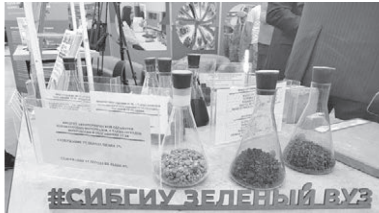
■ Фото пресс-службы замгубернатора А. А. Панова.

«Распадская угольная компания» показала часть мероприятий своей экологической программы, в том числе технологию пылеподавления и модель экополигона, где ведут исследо-