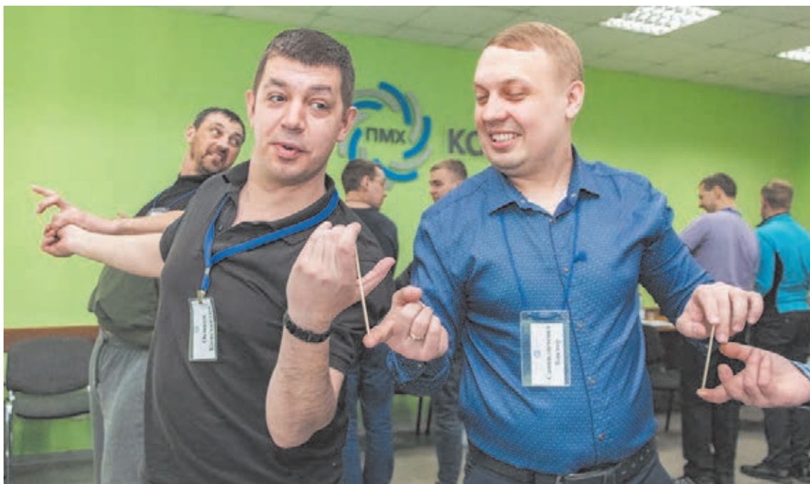
■ На заводе постоянно проходят обучающие мероприятия и командообразующие тренинги.

“ НУЖНО РАБОТАТЬ НЕ ТОЛЬКО С ВУЗАМИ И ССУЗАМИ, НО И СО ШКОЛЬНИКАМИ, ДАЖЕ НЕ ВЫПУСКНЫХ КЛАССОВ, А НАЧИНАЯ С НАЧАЛЬНОЙ ШКОЛЫ. РАССКАЗЫВАТЬ ИМ О ТОМ, ЧТО ТРУДИТЬСЯ НА ПРОМЫШЛЕННОМ ПРЕДПРИЯТИИ – ЗДОРОВО И ПЕРСПЕКТИВНО, ЧТО ЭТО НЕ ТОЛЬКО РАБОТА, НО И МНОЖЕСТВО РАЗНЫХ НАПРАВЛЕНИЙ, В КОТОРЫХ МОЖНО РАЗВИВАТЬСЯ МОЛОДЁЖИ: СПОРТ, НАУКА, БЛАГОТВОРИТЕЛЬНОСТЬ, ВОЛОНТЁРСТВО. НУЖНО ОБЪЯСНЯТЬ ДЕТЯМ, ЧТО РЕАЛИЗОВАТЬСЯ КАК ПРОФЕССИОНАЛ ВОЗМОЖНО И НА ПРОМЫШЛЕННОМ ПРЕДПРИЯТИИ, ЗДЕСЬ РЕАЛЬНО ПРОЙТИ ТРУДОВОЙ ПУТЬ ДО ТОП-МЕНЕДЖЕРА.