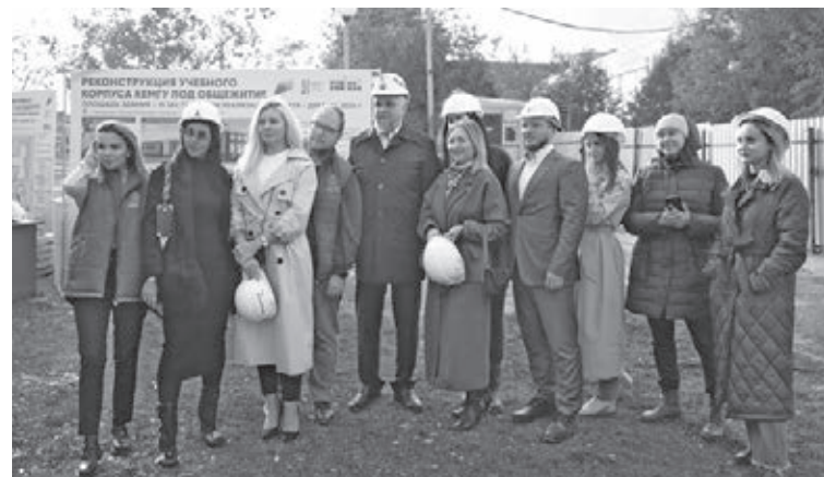
■ Фото Сергея Шпица.

и блогосферы в буквальном смысле слова прикоснулись к истории. Изучили проект, побывали на смотровой площадке, заглянули в помещения, узнали цвета фасадной одежды стен (они будут сдержанными – преобладающие белый и коричневый). В пустых локациях каждый мысленно расставил мебель и с нежной грустью вспомнил студенческие годы.