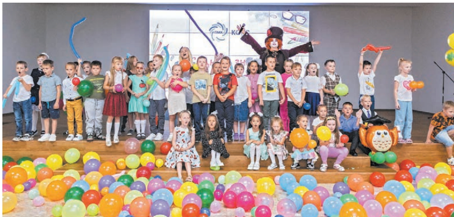
■ Для детей коксохимиков проводятся весёлые мероприятия и праздники.