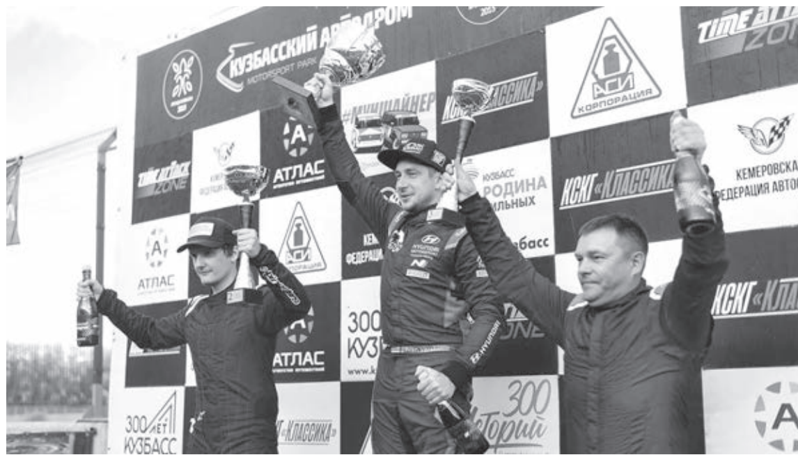
Победители нынешнего года.

Добавим: выдавать разряды за абсолютный триумф на Кузбасском автодроме начали