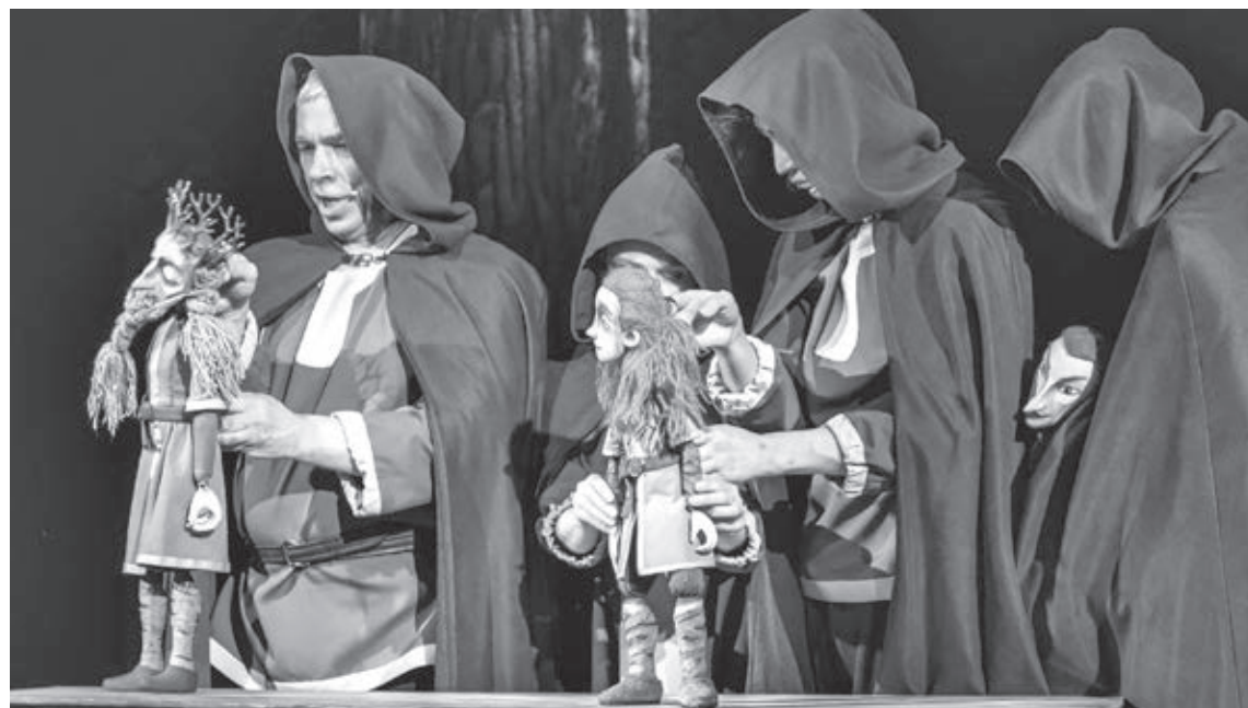
■ Кадр из уже нашумевшего спектакля «Рагнарёк: гибель богов», режиссер Станислав Садыков.